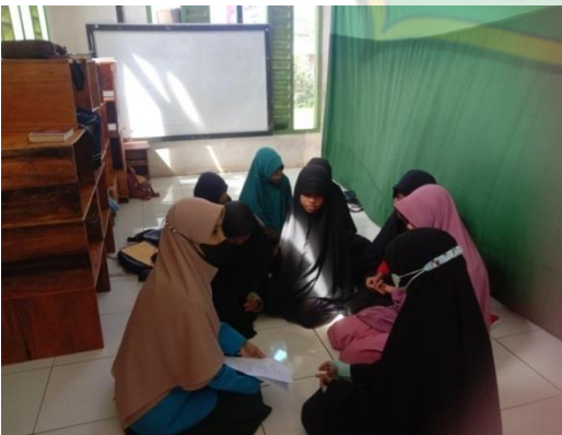
(مقابلة مع سوليس)