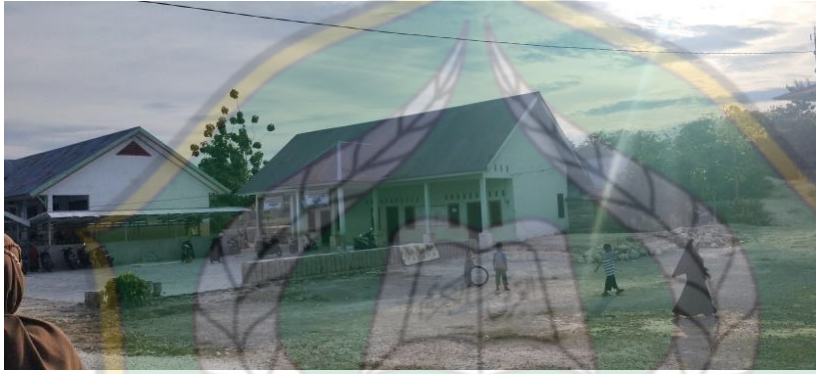
صفحة فمعهد سلفية الأمين ماواسنكا