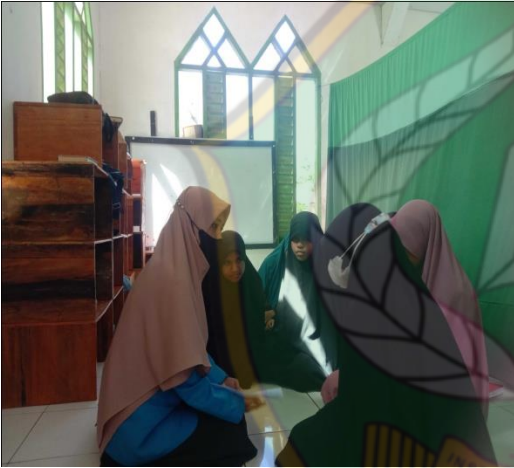
(مقابلة مع عفيفة)