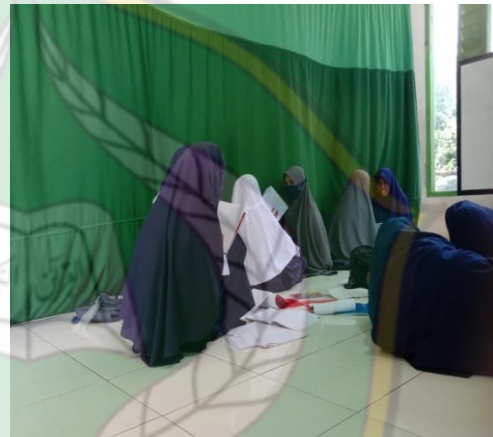
عملية أنشطة تعلم اللغة العربية الصف السابع, خميس ٩ مارس ٢٠٢٣