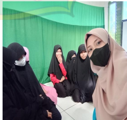
عملية أنشطة تعلم اللغة العربية الصف السابع, الثلاثاء ١٤ مارس ٢٠٢٣