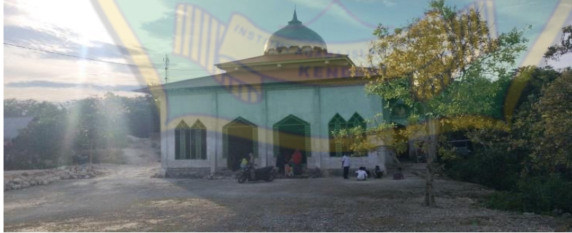
مسجد في معهد سلفية الأمين ما واسنكا