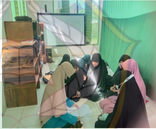
(مقابلة مع فترفة)