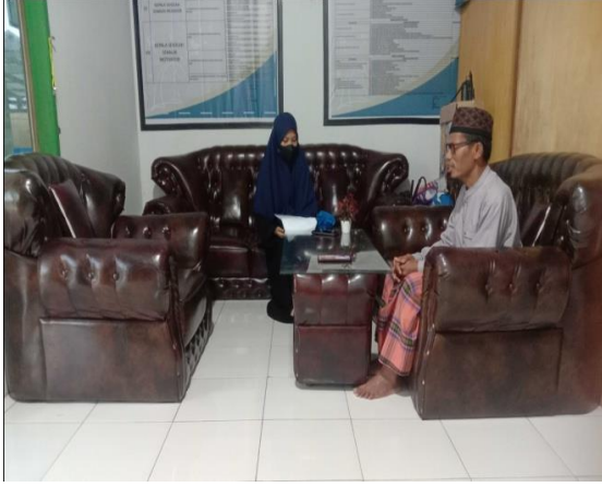
(مقابلة مع رئيس المدرسة)