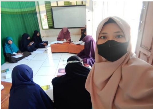
(مقابلة مع فترى)