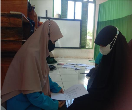
(مقابلة مع رفكو)