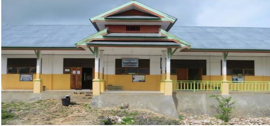
غرفة المعلمون في معهد سلفية الأمين ماواسنكا