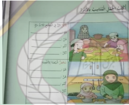
الشكل ١١. تدريبات علي القراءة الصفحة ٥٣

تم العثور على شكل العباء المزدوج في الصفحة ٥٣ من الفصل ٣ حول موضوع ممارسة الكتابة التي تصف دور الأسرة مثل الأم التي تحمل الأرز والأب يأكل وطفلاه يأكلون الطعام, ثم الصورة التالية هي رسم توضيحي لصورة أم وطفل يطبخان الطعام. توضح هذه الصفحة أن المرأة تتحمل عبئًا مزدوجًا، ألا وهو الطبخ وتحضير الطعام في المطبخ بينما يصور الرجل وهو يأكل الطعام المقدم. يمكن ملاحظة ذلك من خلال الصورة التالية: