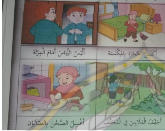
الشكل ٤ . المفردات والعبارات الصفحة ٣٧

الصفحتين ٣٧ و ٣٨ تبين أن المحل مناسب للمرأة وهي: غسل الصحون والكنس وتجفيف الملابس والكي وسقي الزهور وتحضير الطعام والطبخ في المطبخ. يمكن ملاحظة ذلك من خلال الصورة التالية: