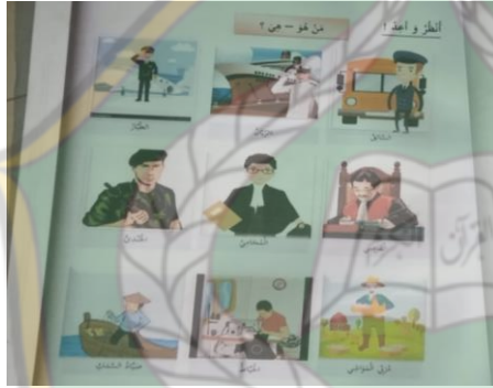
الشكل ٨. المفردات والعبارات الصفحة ٦٤

كما توجد أشكال التهميش في الصفحة ٦٤ بنفس الموضوع، وهي المفردات والعبارات حول المهنة. يوجد في هذه الصفحة تسعة رسوم توضيحية لرجال توضح أدوارهم سائق، رباتان، قائد الطائرة، حاكم، محام، جندي، مربّي الحيوانات، تربي و صياد السمك. يتم تصوير هذا الدور فقط من قبل المذكر دون إشراك المؤنث حتى تتعرض المرأة التهميش. يمكن ملاحظة ذلك من خلال الصورة التالية: