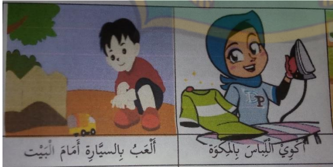
الشكل ٥ . المفردات والعبارات ص ٣٨