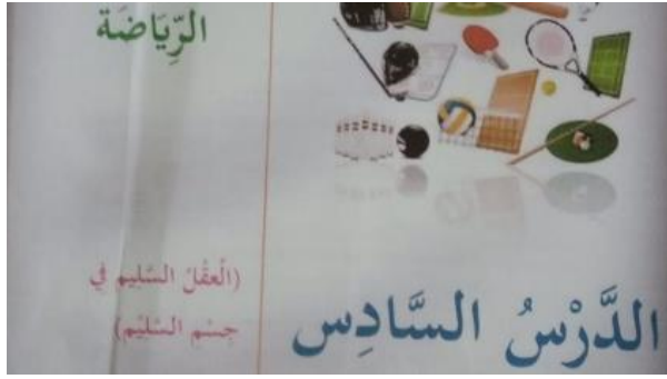
الشكل ١٤. الرياضة الدرس الخامس

الكتاب المدرسية هي كتب يتم استخدامها دائماً عند الدراسة من قبل الطلاب بحيث تحتاج الكتابة في الكتب المدرسية اللغة العربية إلى الاهتمام المناسب لأنها يمكن أن تؤثر على فهم القراء إذا لم يتم الاهتمام بها من حيث الكتابة بحيث يسهل فهمها ولا يوجد سوء تفاهم.