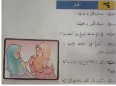
الشكل ٢. الحوار صفحة ٩