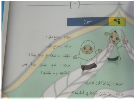
الشكل ٣. الحوار صفحة ٧٠