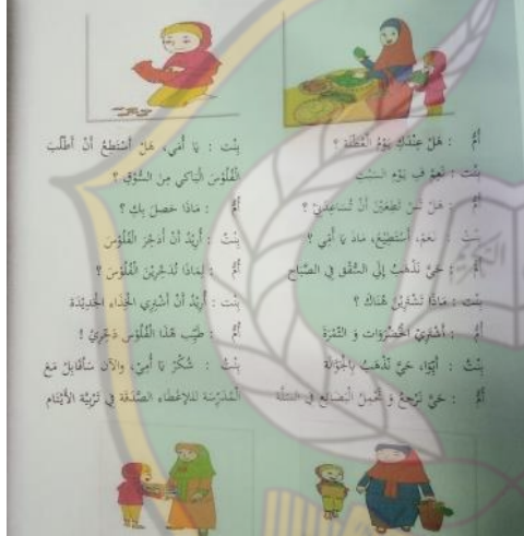
الشكل ٦. الحوار صفحة ٤١