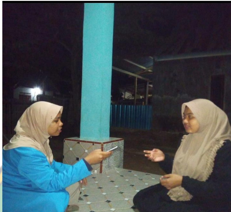
Foto Saat Wawancara Dengan Jamaah Tablig