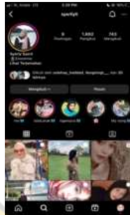
(Gambar 1 : Akun Instagram Serlyanti)

Dari hasil wawancara kepada Mahasiswi Serlyanti mengungkapkan bahwa dirinya mulai bergabung di Instagram sejak awal tahun 2020, serlyanti awalnya tidak begitu tertarik dengan Instagram sebab alasan awalnya adalah hanya mengikuti teman-temannya. Namun, seiring berjalannya waktu serlyanti mulai tertarik dan aktif menggunakan Instagram bahkan sampai 4-6 kali dalam sehari. Banyaknya hal yang menarik yang ada di Instagram membuat Serlyanti sering membuka Instagram untuk melihat postingan yang sedang trend, sebagai seorang yang tertarik dengan fashion tentunya hal ini sudah menjadi hal yang biasa. Serlyanti mengungkapkan bahwa Instagram menjadi media yang sering digunakannya untuk mencari-cari kebutuhan seperti mencari referensi fashion dan makeup, serlyanti juga memilih akun-akun fashion yang dijadikan sebagai bahan referensi dalam trend fashionya. Serlyanti juga mengatakan bahwa alasan mengapa memilih Instagram sebagai media trend fashionnya, karena menurutnya Instagram lebih cepat update sebagai media untuk berbagi foto atau video, ditambah dengan banyaknya fitur-fitur terbaru sehingga memberikan rasa ketertarikan kepada