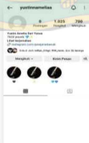
(Gambar 2 : Akun Instagram Yustin)

“Iya saya memiliki akun Instagram, yang saya gunakan biasanya 4-5 kali dalam sehari dan itu pun tergantung kebutuhan saya untuk mencari sesuatu termasuk mencari referensi fashion. sebenarnya banyak platform media sosial yang saya gunakan untuk sumber referensi saya dalam fashion dan Instagram menjadi salah satu media yang sering saya gunakan juga, karena banyaknya akun- akun trend fashion jadi lebih mempermudah saya dalam cari referensi fashion. untuk brand atau merk saya bukan tipekal yang memprioritaskan brand atau merk tapi ada satu merk yang saya sukai yaitu jiniso. Saya juga mengikuti salah satu akun Influencer (@tamaradai). Alasan saya menggunakan Instagram sebagai media trend fashion karena banyak akun-akun yang memberikan fashion yang menarik dan juga Instagram banyak merekomendasikan lewat reels sehingga memperbanyak masukan fashion yang dapat, lebih mudah mencari trend fashion karena sudah di permudah oleh pihak Instagramnya