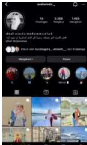
(Gambar 3 : Akun Instagram Winda)

Begitu juga senada yang di ungkapkan Mahasiswi Riska Amalia (@riskaamalia.04) Mahasiswi Tadris Bahasa Arab.