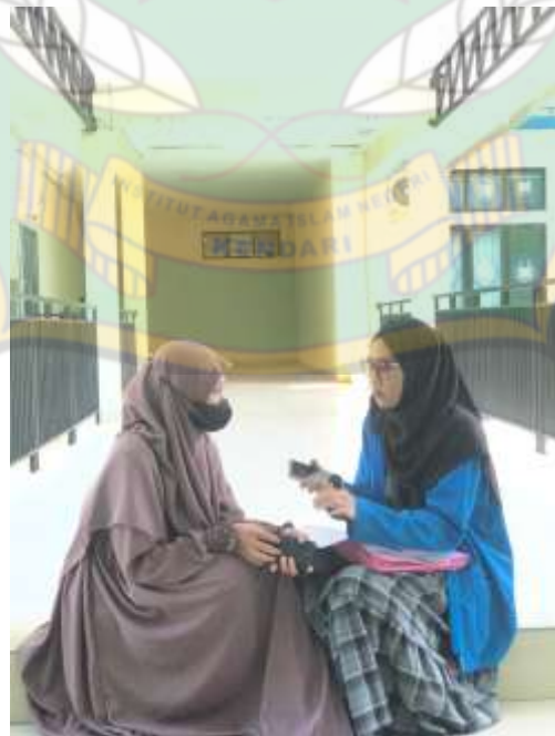
Wawancara dengan mahasiswi pengguna media Instagram