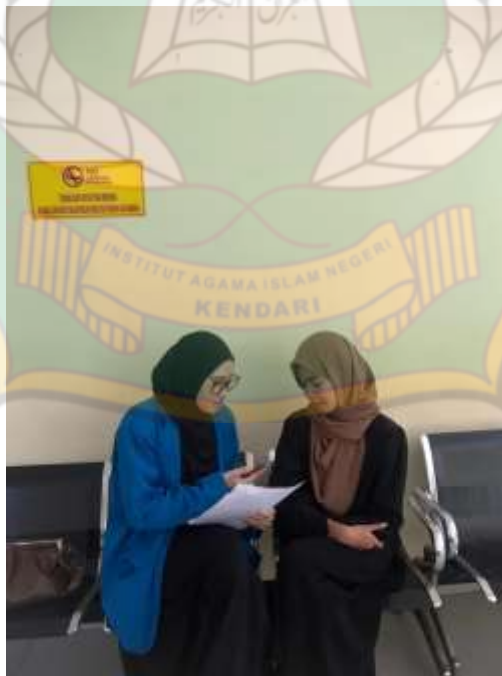
Wawancara dengan mahasiswi pengguna media Instagram