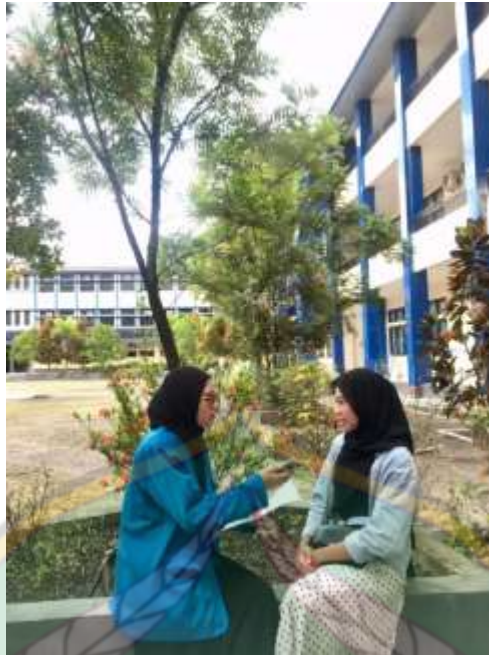
Wawancara dengan mahasiswi pengguna media Instagram