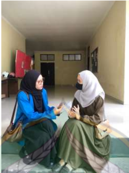
Wawancara dengan mahasiswi pengguna media Instagram