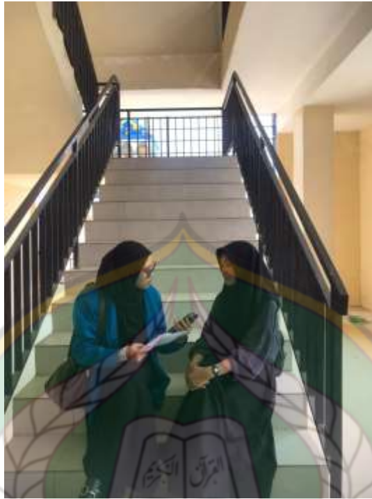
Wawancara dengan mahasiswi pengguna media Instagram