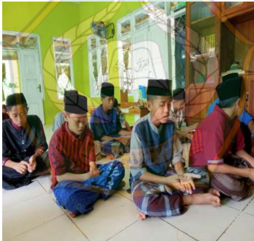
Gambar 4.10: Zikir dan wiridan bersama setelah sholat berjamaah.