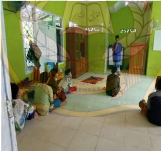
Gambar: 4.9. Santri saat sedang melakukan latihan dakwah