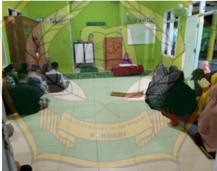
Gambar 4.7. Santri Pondok Pesantren Darul Hijrah sedang bersiap untuk menyetorkan hapalannya.