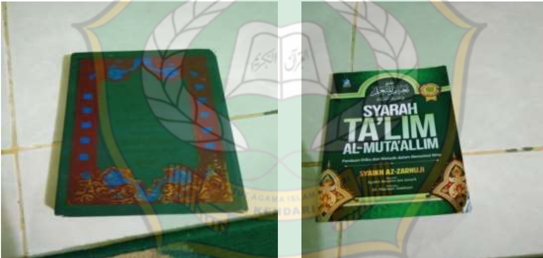
Gambar 4.11 Kitab balgul maram dan kitab Ta'lim muta'allim yang dkaji