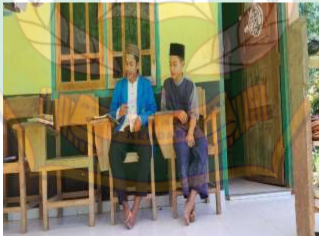
Gambar 4.4. Wawancara dengan salah satu santri, yang sudah pernah keluar untuk berdakwah