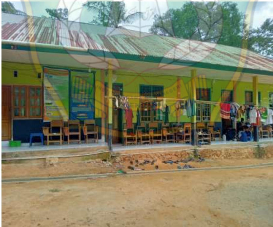
Gambar: 4.10. Sarana dan prasarana penunjang pembinaan dakwah