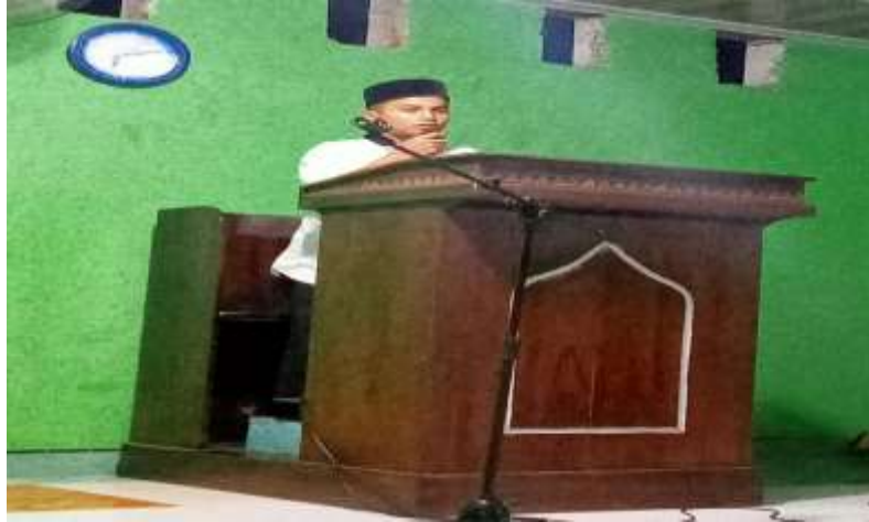
Gambar 4.5. Salah satu aktivitas dakwah santri di masyarakat