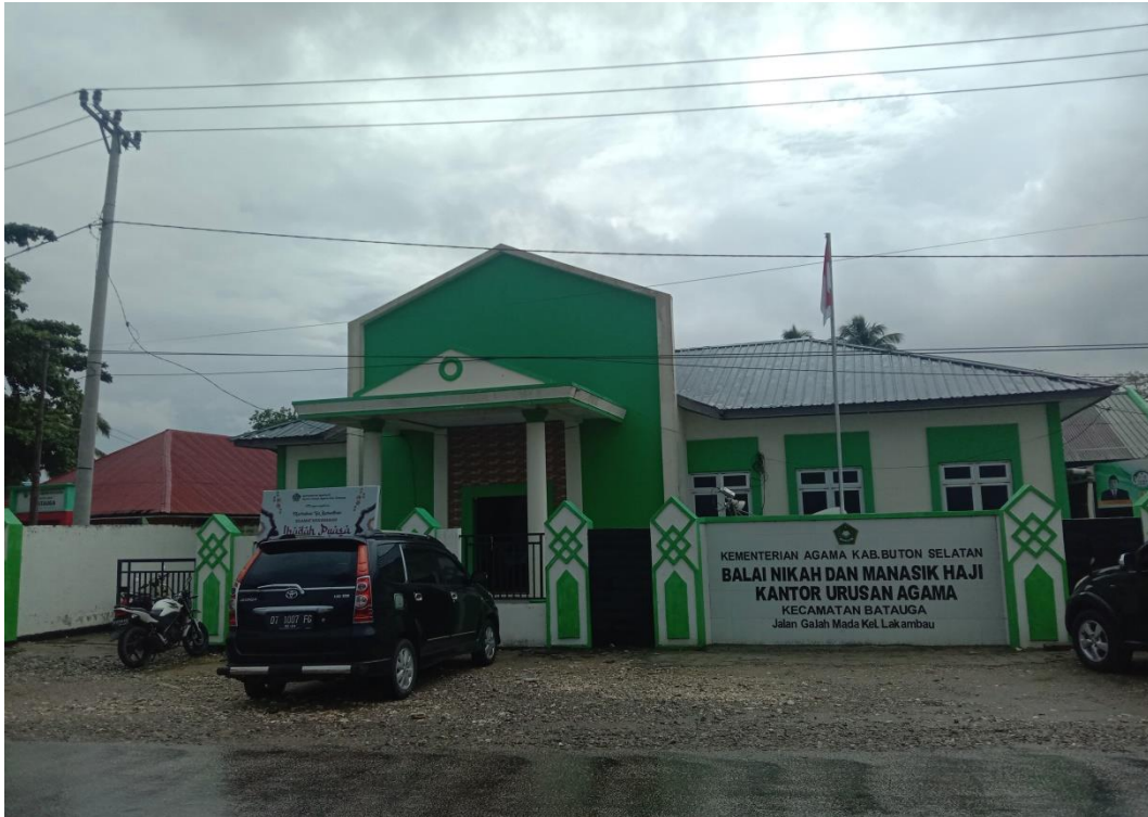
Gambar lokasi penelitian Kantor Urusan Agama Kecamatan Batauga Kabupaten Buton Selatan