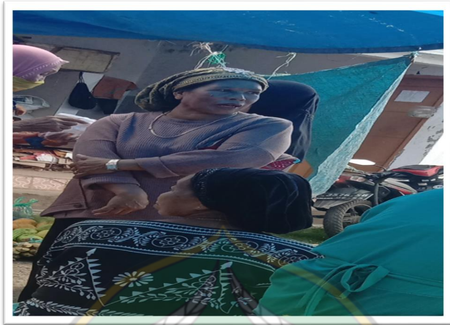
Gambar Bentuk pameran