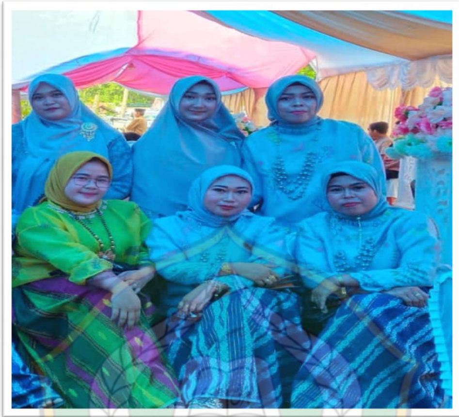
Gambar Bentuk Pamer di desa langgomali