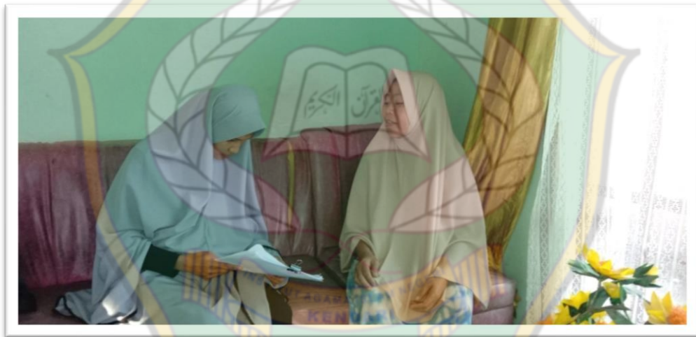
Wawancara Bersama Hayatan