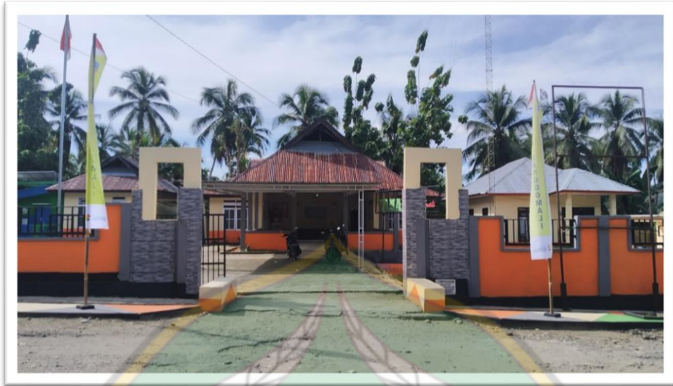
Gambar Kantor Desa Langgomali