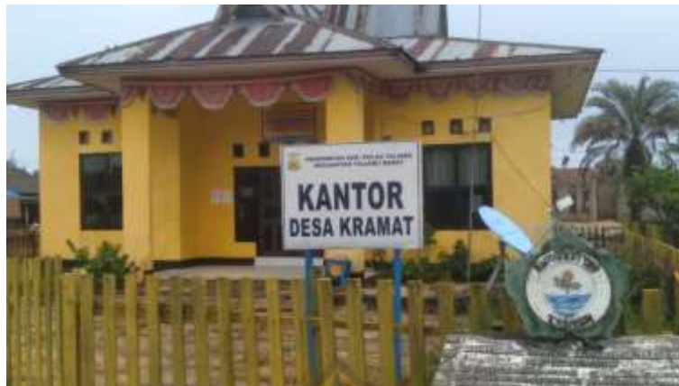
Ketgam: Gedung Kantor Desa Kramat