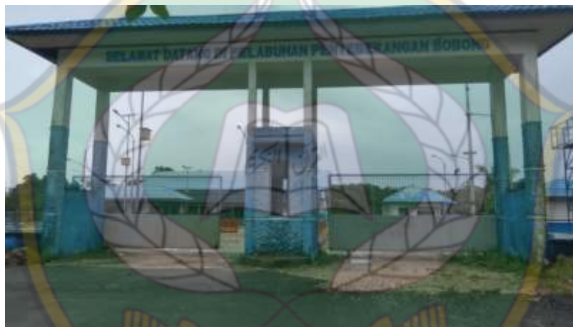
Ketgam: Pelabuhan Penyebrangan Bobong Desa Kramat