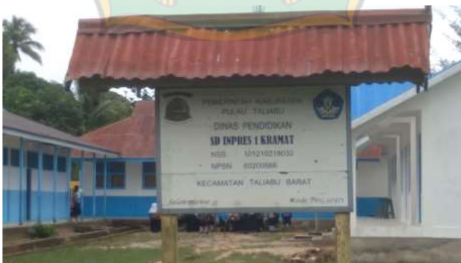
Ketgam: Sekolah Dasar Impres 1 Kramat