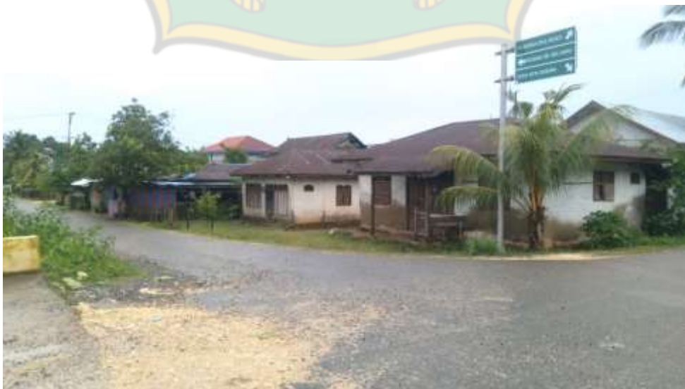
Ketgam: Jalan di Desa Kramat