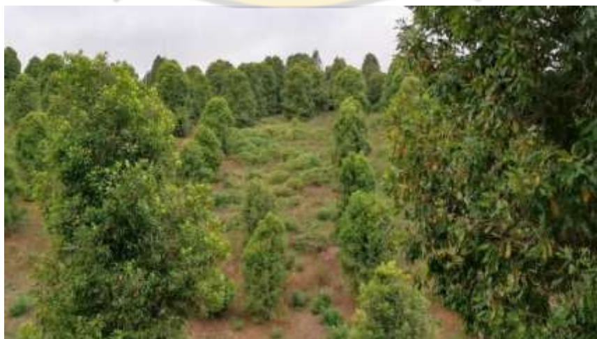
Ketgam: Salah satu perkebunan cengkih di Desa Kramat