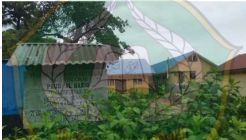
Ketgam: PAUD AL BARIQ Desa Kramat