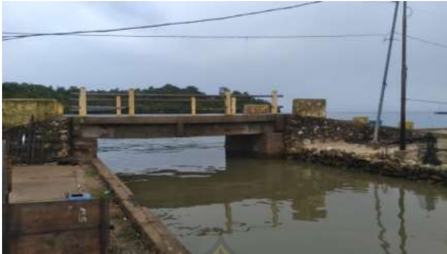
Ketgam: Jembatan Penghubung Dusun I dan 4