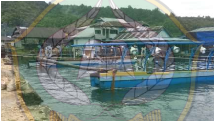
Ketgam: Tempat Pelelangan Ikan Desa Kramat