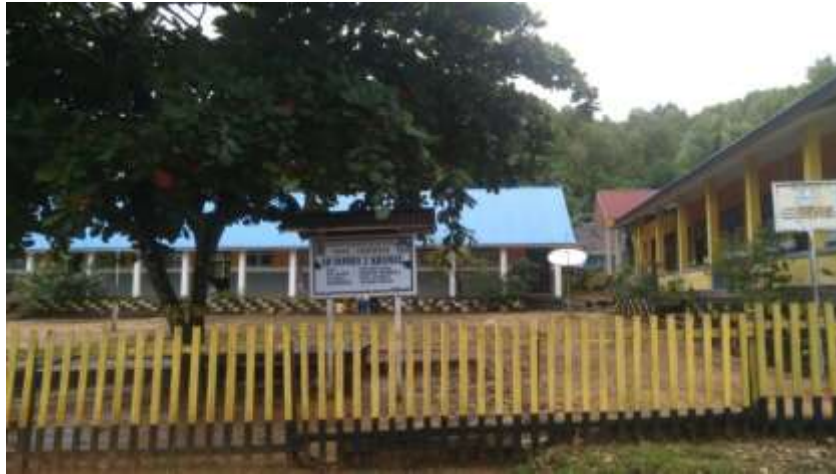
Ketgam: Sekolah Dasar Impres 2 Kramat