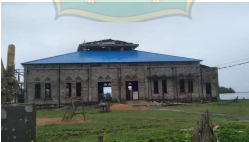
Ketgam: Masjid Al- Mujahidin Desa Kramat