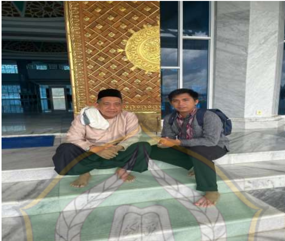
(Wawancara Bersama Pengurus Masjid Al-Alam)