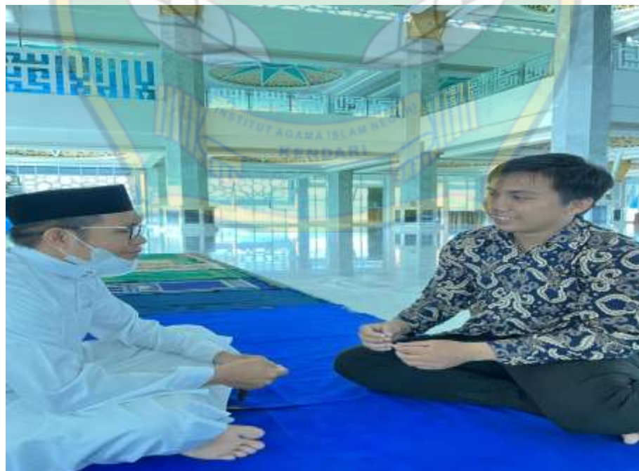
(Wawancara Bersama Imam Masjid Al-Alam)