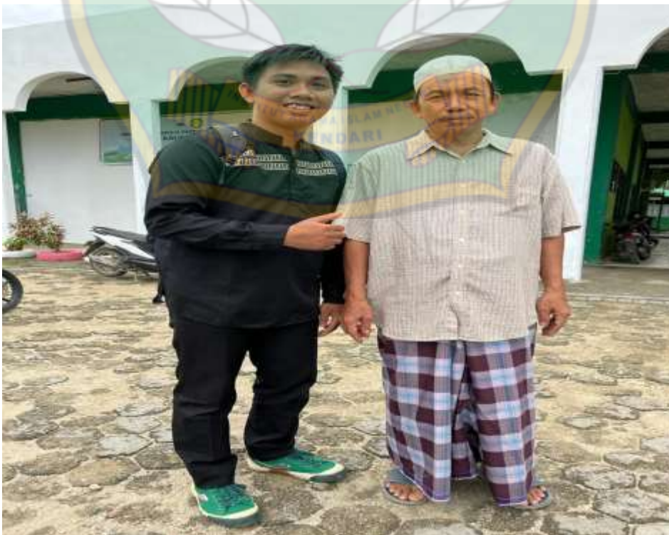
(Wawancara Bersama Pengurus Masjid Al-Kautsar)