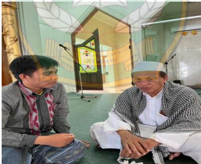
(Proses Wawancara Dengan Imam Masjid Al-Kautsar)