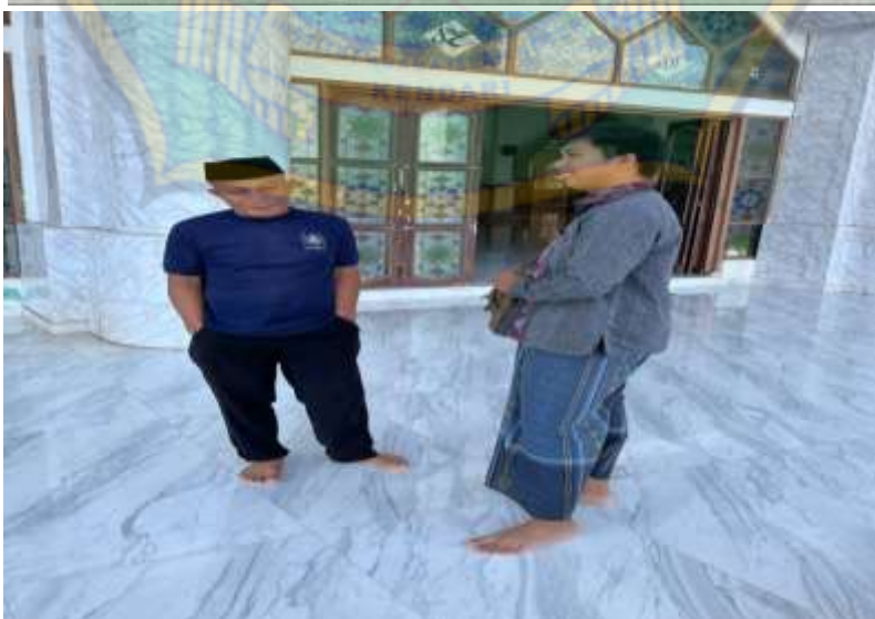
(Wawancara Bersama Jamaah Masjid Al-Alam Dan Masjid Al-Kautsar)