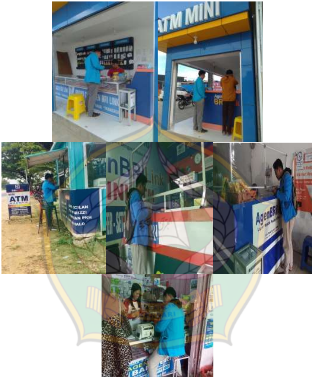
Gambar 1.1 Wawancara dengan Agen BRILink