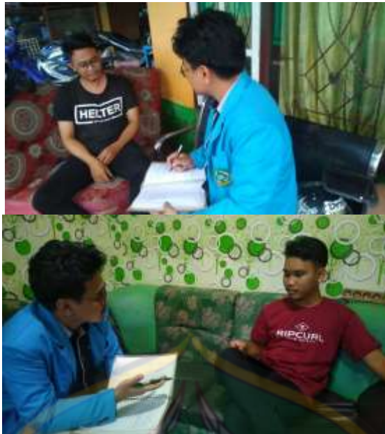
Gambar 1.2 Wawancara dengan Konsumen BRILink