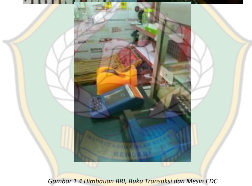
Gambar 1 4 Himbauan BRI, Buku Transaksi dan Mesin EDC