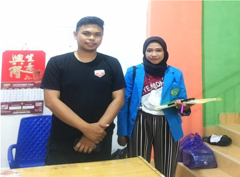
Owner Kasinta store