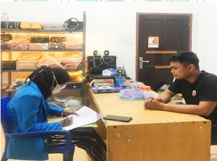
Wawancara bersama owner