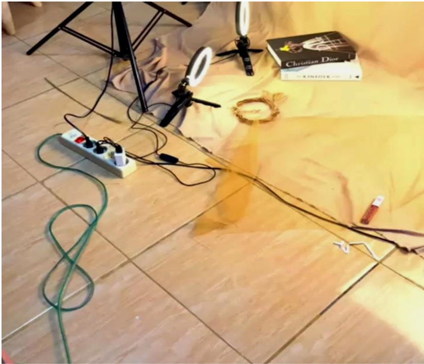
Pengambilan gambar untuk diunggah ke instagram