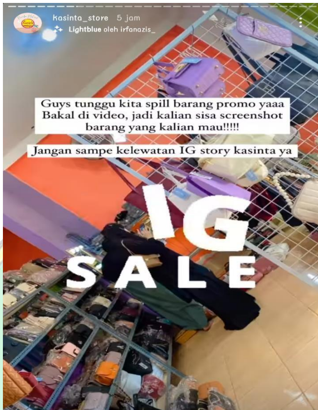
Promo Kasinta store