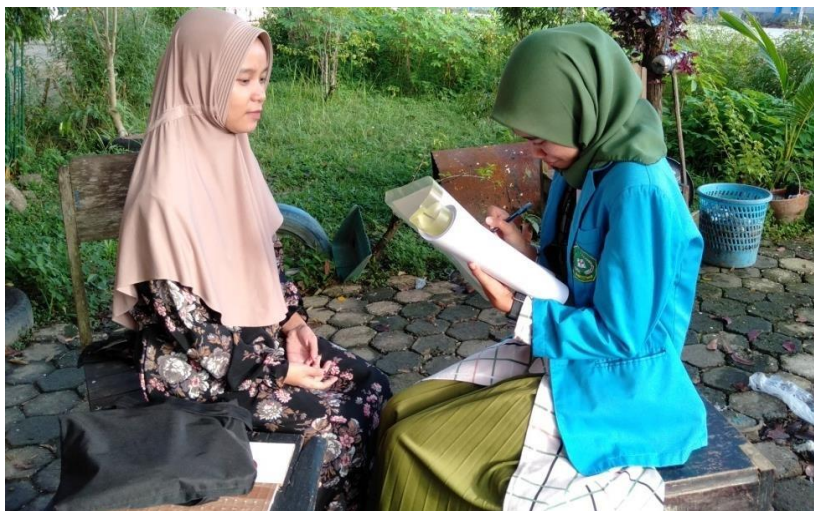
Wawancara bersama informan