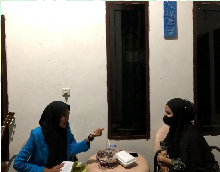
Wawancara bersama informan