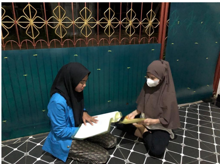
Wawancara bersama informan