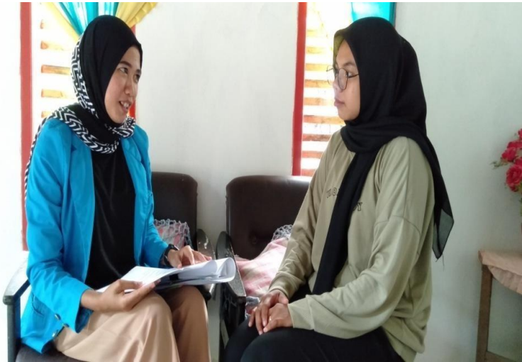
Wawancara bersama informan