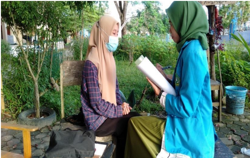
Wawancara bersama informan