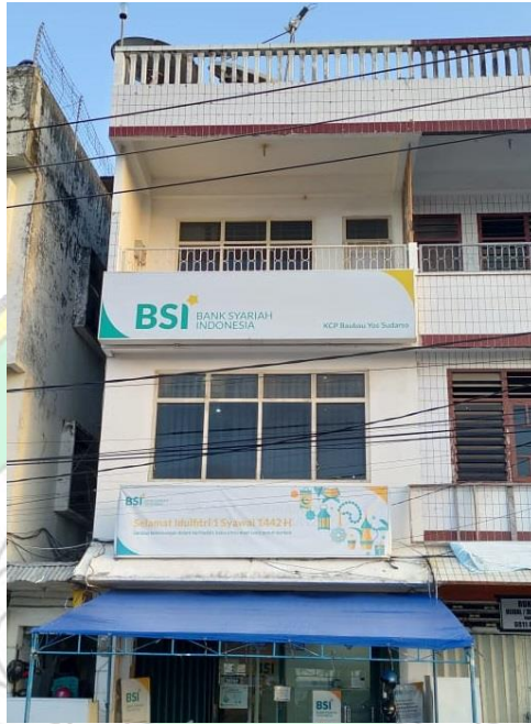
Kantor Bank Syariah Indonesia Kcp Yos Sudarso Kota Bau-Bau