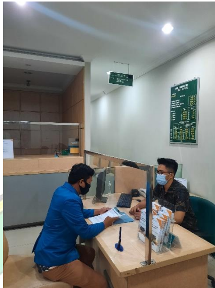
Wawancara bersama karyawan bank syariah Indonesia kep yos sudarso kota bau-bau