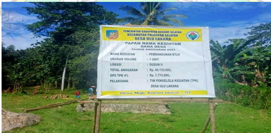
Gambar baleho bantuan rumah pemerintah