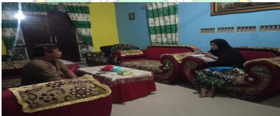
Wawancara dengan Bapak Desa