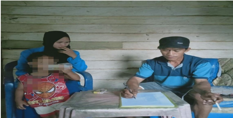
Wawancara dengan bapak kuli pemborong bangunan