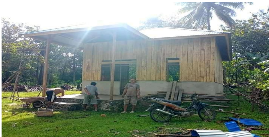
Proses pembangunan rumah bantuan pemerintah