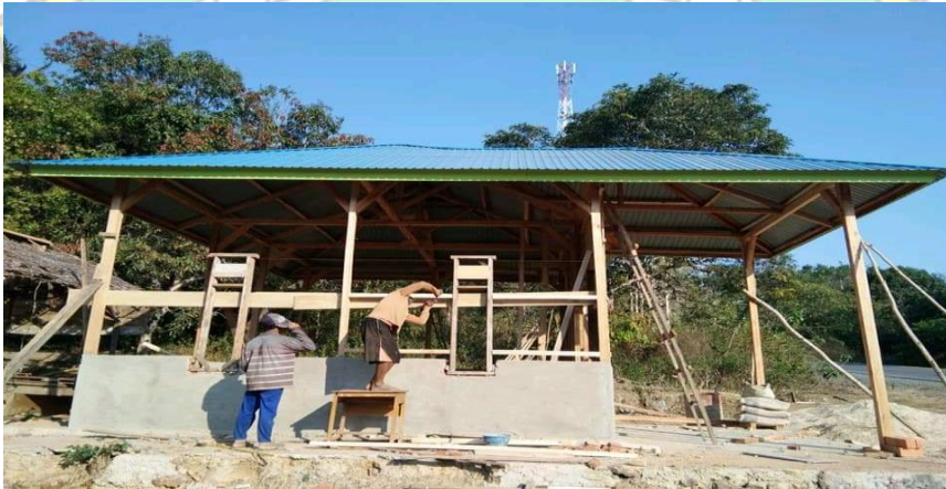
Proses pemasangan jendela rumah