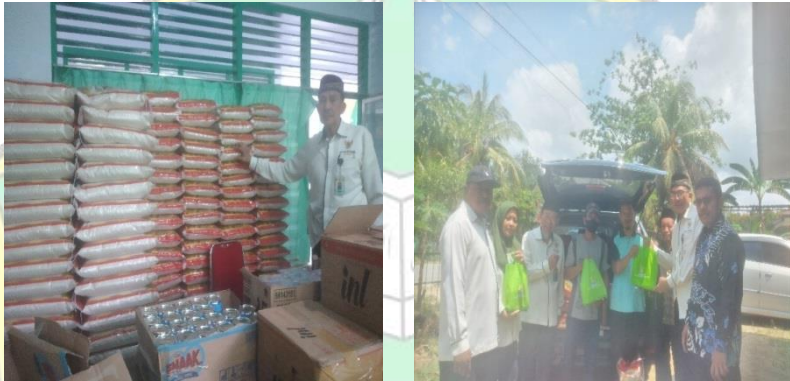
Dokumentasi kegiatan pada penyaluran zakat