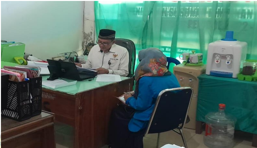
Wawancara dengan Pihak BAZNAS Kota Kendari