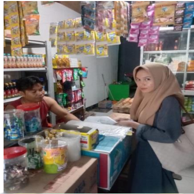
Dokumentasi wawancara dengan para mustahiq