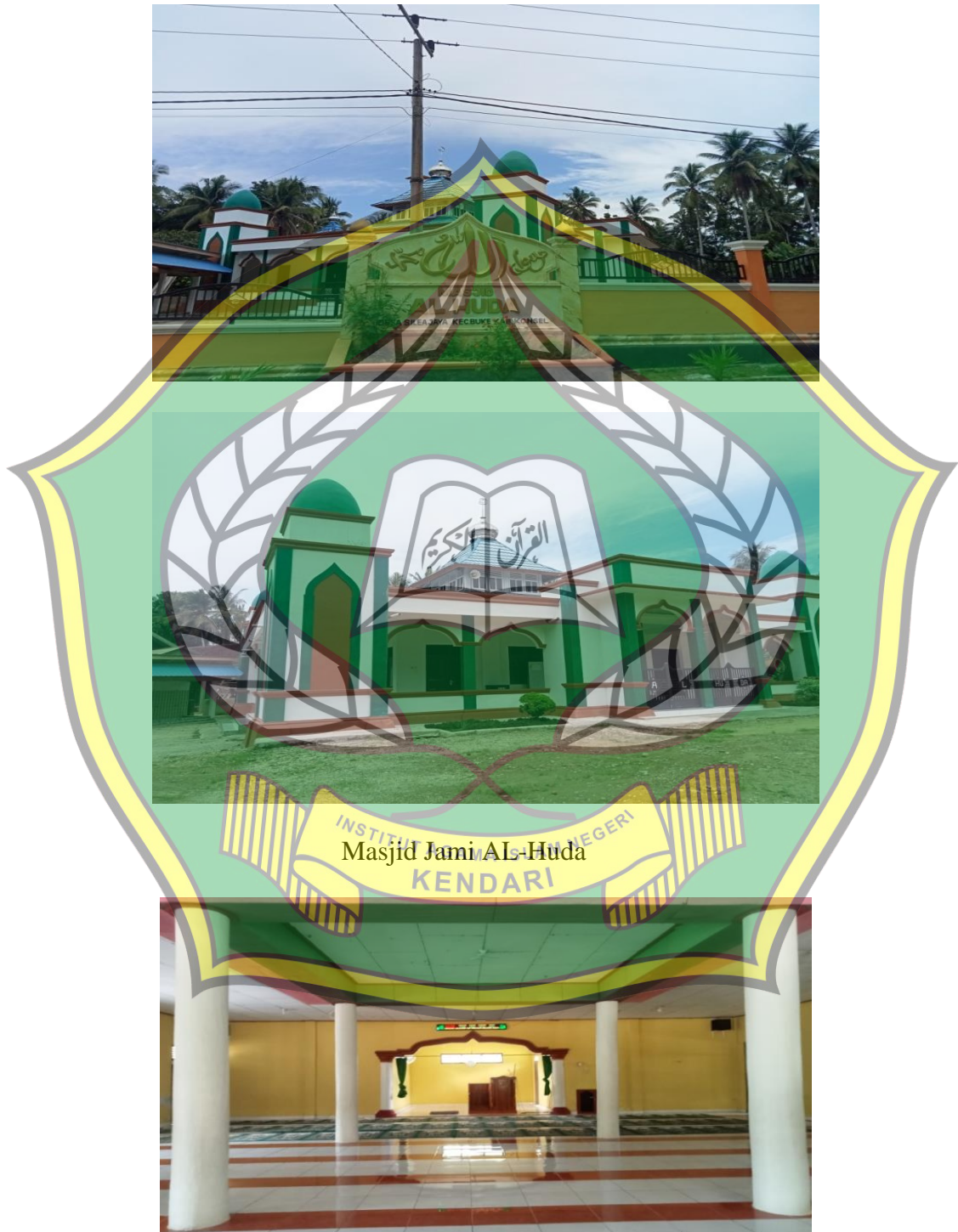
Suasana dalam Masjid