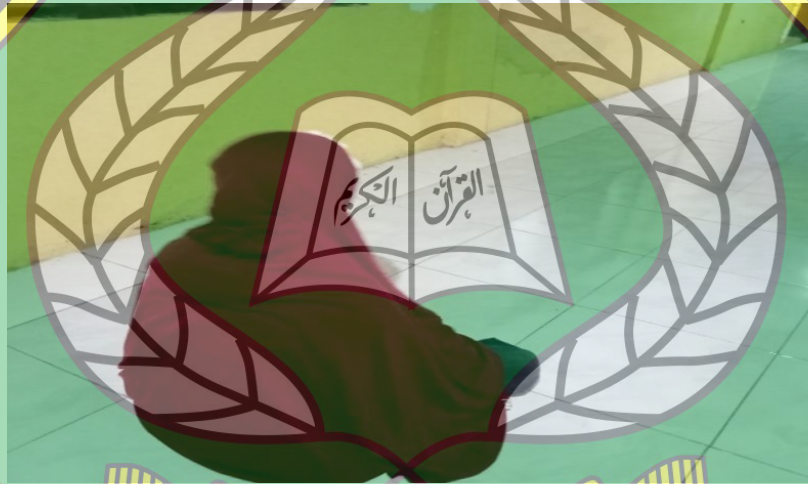
Suasana Kegiatan Shalat Magrib Berjamaah