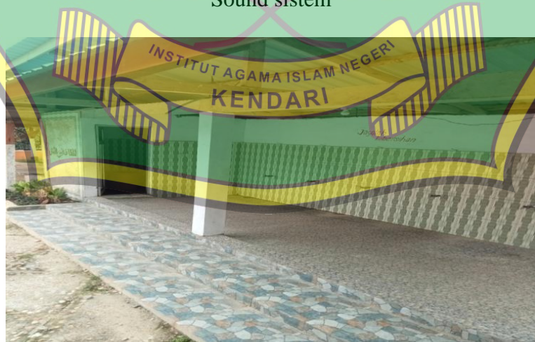
Suasana Tempat Wudhu Dan Kamar Mandi Masjid Jami AL-Huda