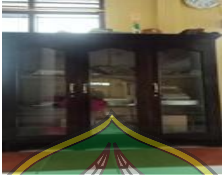
Lemari Masjid Jami Al-Huda