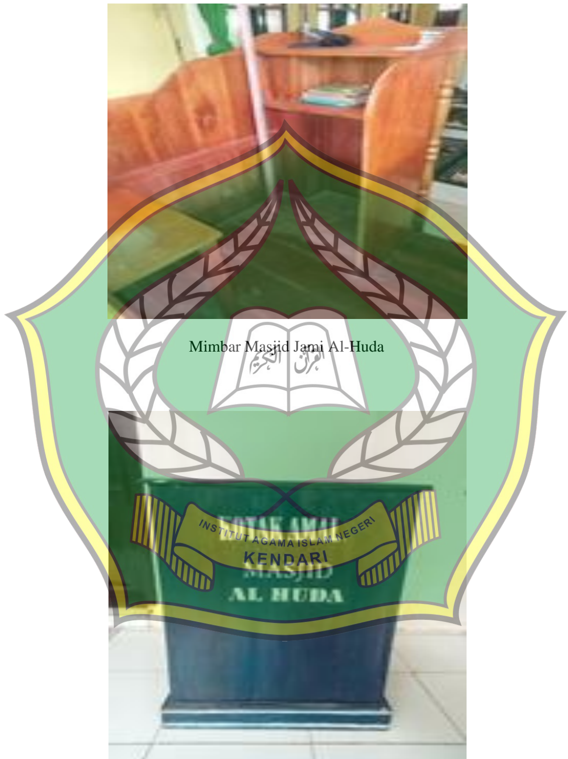
Mimbar Masjid Jami Al-Huda