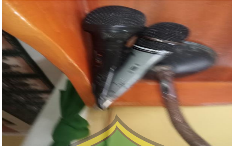
Pengeras Suara untuk Azan (Mic)