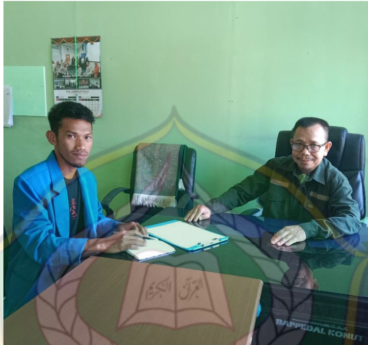
(Wawancara Kepala Seksi Penanganan Pengaduan dan Penyelesaian Sengketa Lingkungan)