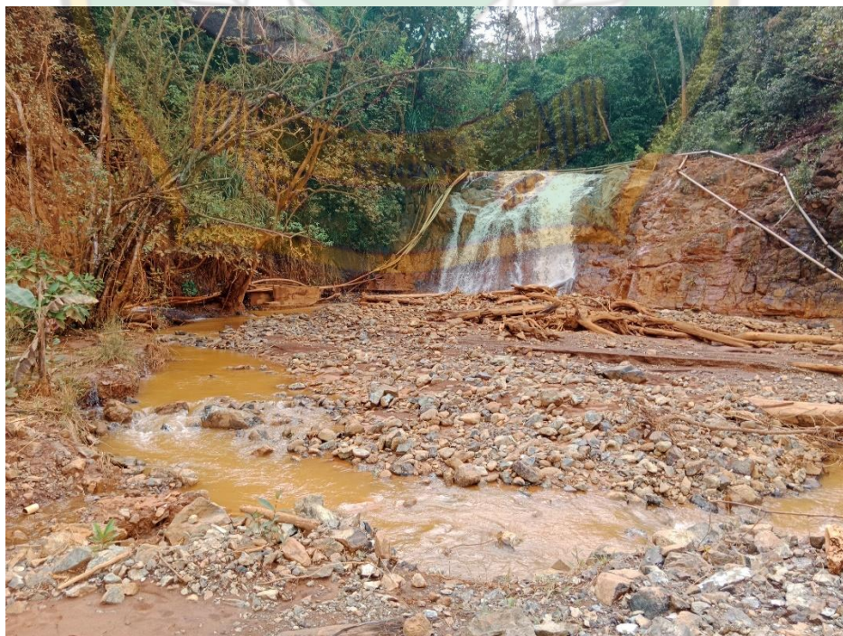
(Dokumentasi Air jatuh Desa Boenaga)