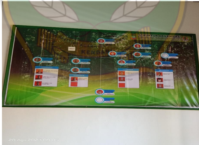
(Badan Struktur Organisasi Dinas Lingkungan Hidup Konawe Utara)