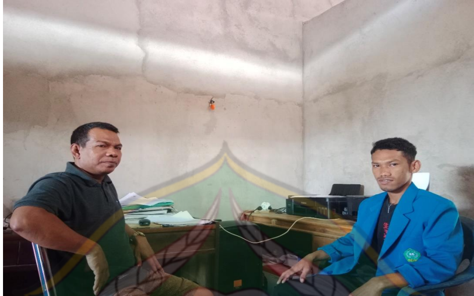
(Wawancara Kepala Desa Boenaga)