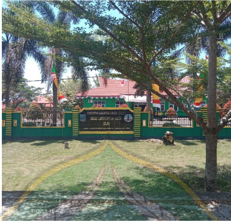
(Perkantoran Dinas Lingkungan Hidup Konawe Utara)