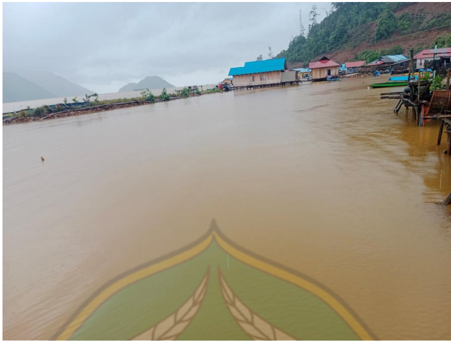
(Dokumentasi Laut Desa Boenaga)