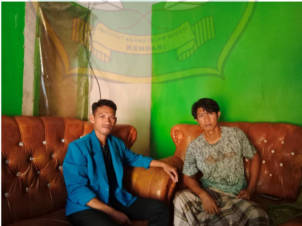
(Wawancara warga Desa Boenaga)