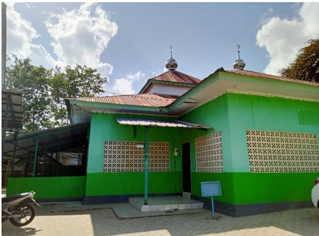
5.2 Musholla SMA Negeri 2 Kendari Tanggal 23 April