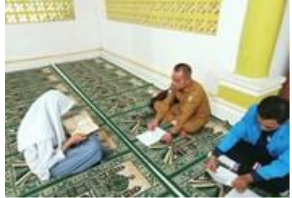
5.3 Proses Tes Kemampuan Membaca Al-Qur'an Tanggal 23 April di musolah