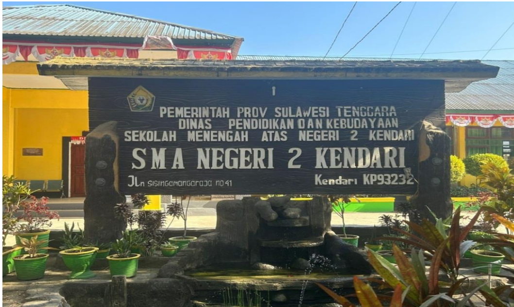
5.1 Profil sekolah SMA Negeri 2 Kendari Tanggal 23 April di halaman depan sekolah SMA Negeri 2 Kendari