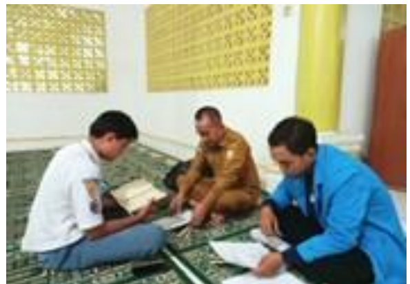
5.5 Proses Tes Kemampuan Membaca Al-Qur'an Tanggal 23 April di musolah