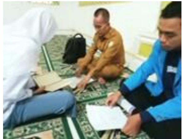
5.4 Proses Tes Kemampuan Membaca Al-Qur'an Tanggal 23 April di musolah