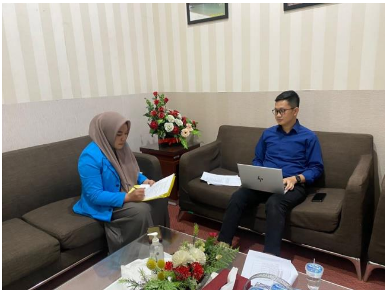
Wawancara pegawai ojk