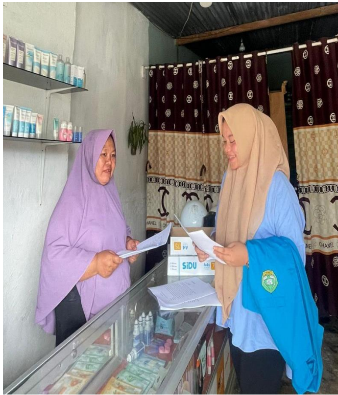
Pemilik UMKM kota Kendari