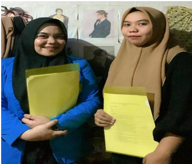
Wawancara masyarakat kota kendari