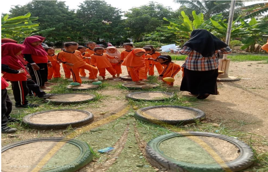
Dokumentasi kegiatan anak melakukan kegiatan bermain egrang batok kelapa