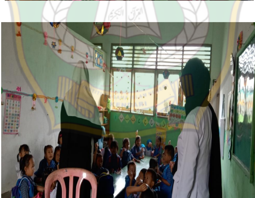
Media egrang batok kelapa