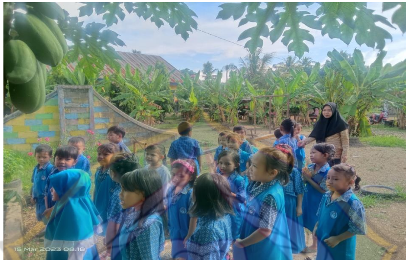
Kegiatan baris-berbaris di depan kelas dan menyanyikan lagu lonceng berbunyi