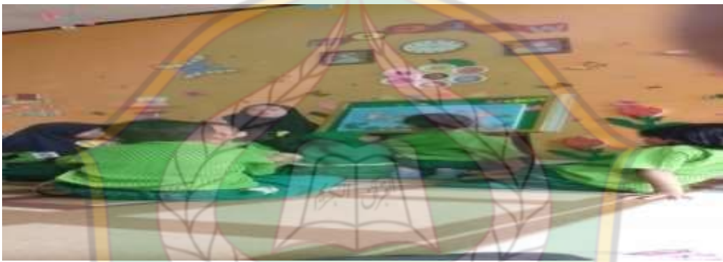
Gambar 4 Pelayanan Kesehatan