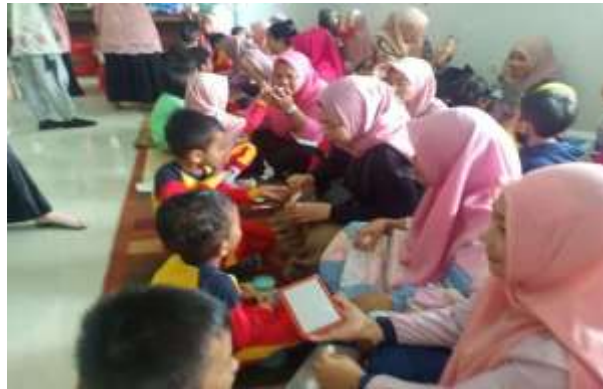
Kerjasama orang tua murid