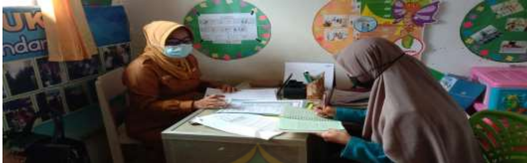
Gambar 7 Wawancara Bersama Guru