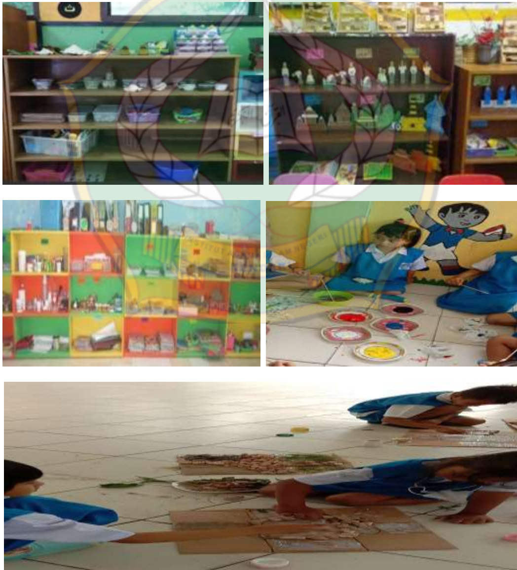
Gambar 2 Alat dan bahan pembelajaran