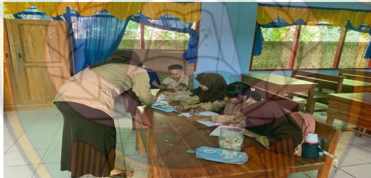
Gambar 6. Guru melakukan pendekatan dengan murid