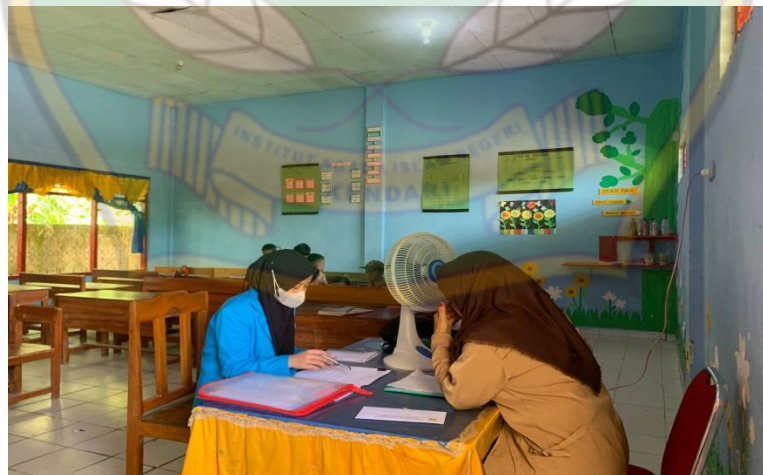
Gambar 2. Wawancara dengan wali kelas 1A