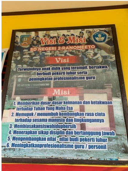
Gambar 8. Visi dan Misi SDN 2 Ranomeeto