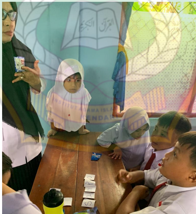
Gambar 4. Guru dan murid sedang berdiskusi