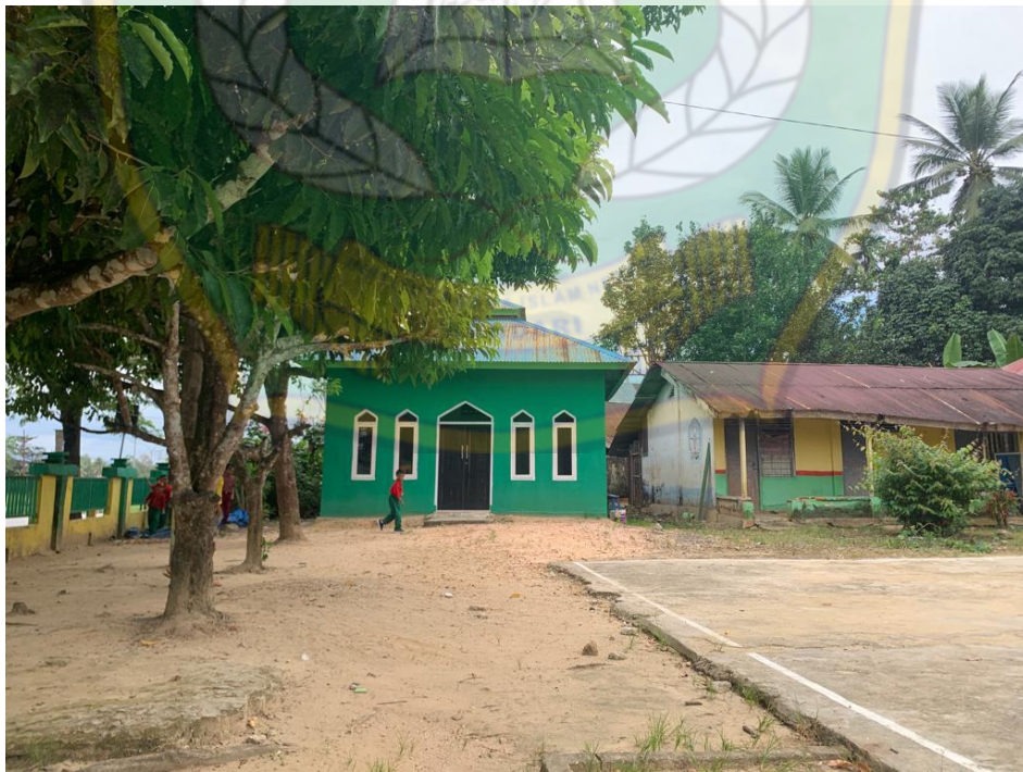
Gambar 12. Musholah