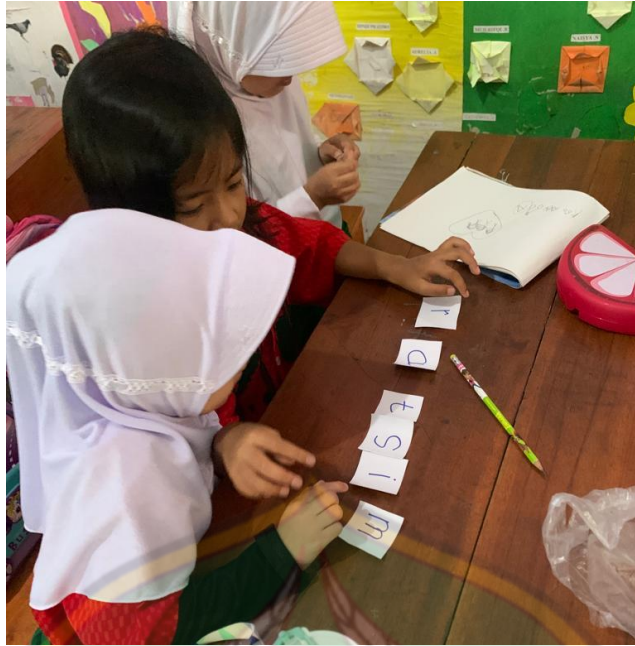
Gambar 5. Murid sedang menyusun huruf menjadi kata