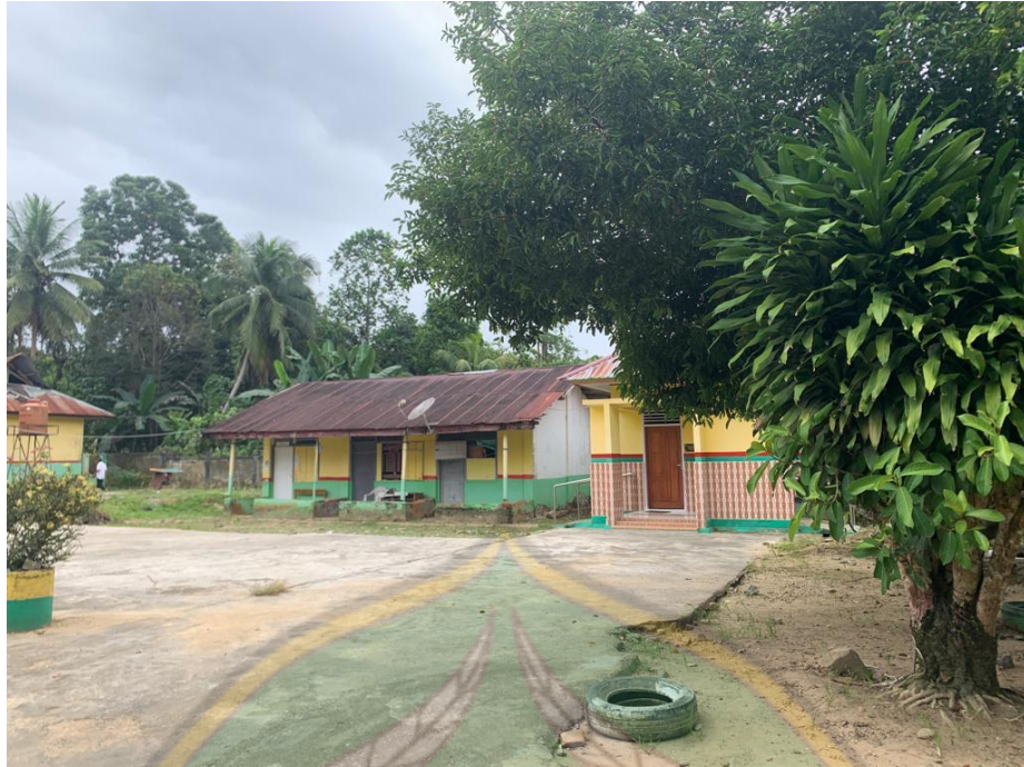
Gambar 11. Toilet