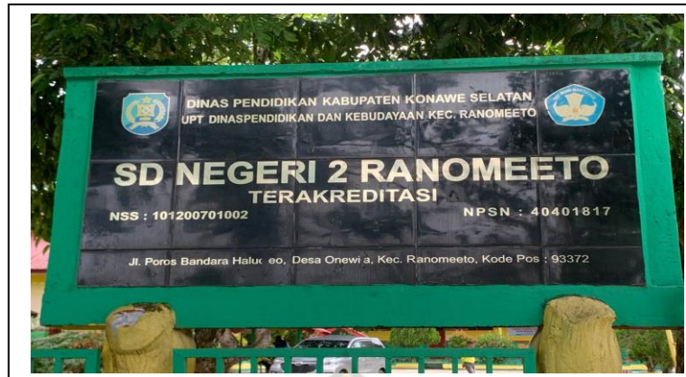
Gambar 4.1 Papan Nama SDN 2 Ranomeeto