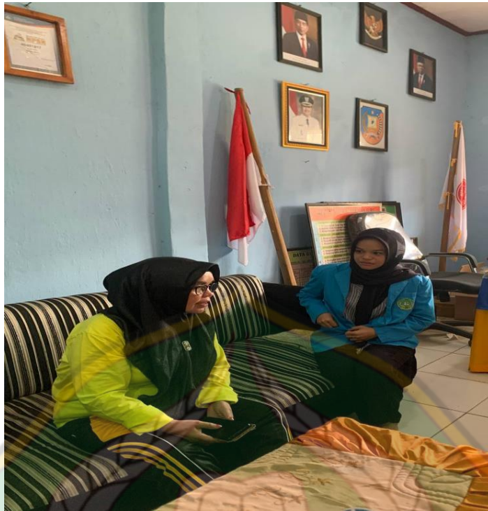
Gambar 1. Wawancara dengan kepala sekolah SDN 2 Ranomeeto