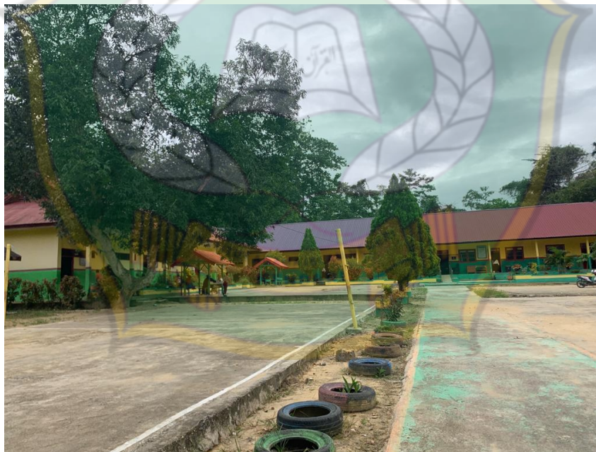
Gambar 10. Halaman sekolah