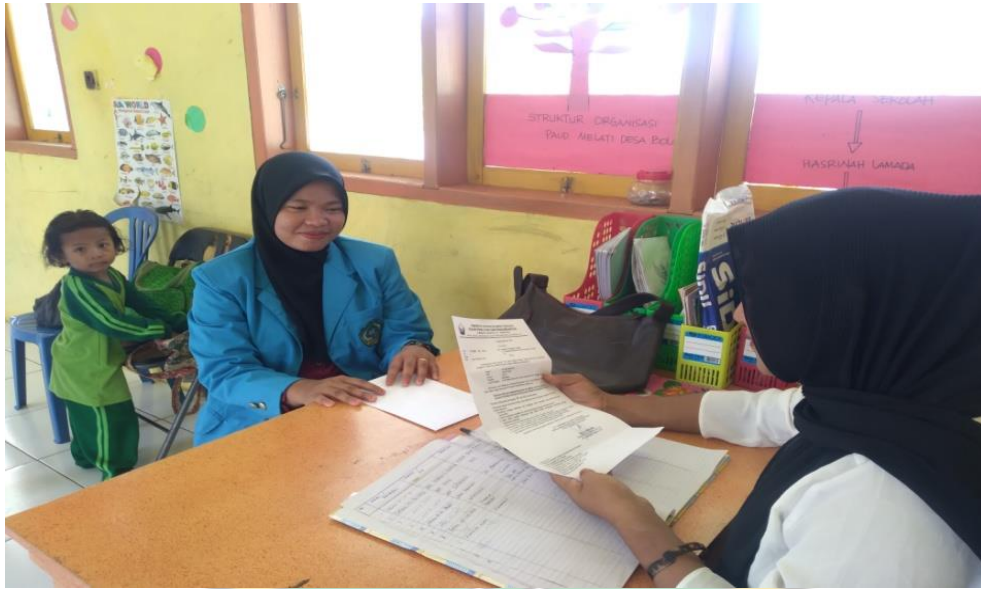
Gambar : Mengantar Surat Izin Penelitian ke Kepala Sekolah PAUD Melati Bolokut Saat di Sekolah