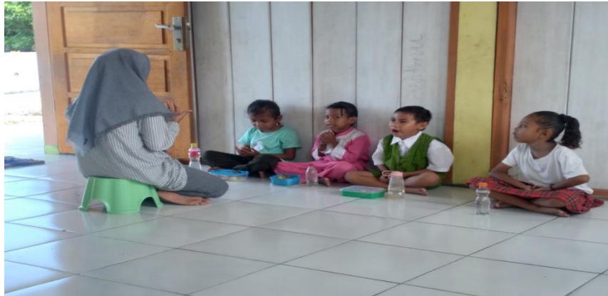
Gambar : Kegiatan Berdo'a Sebelum Makan Bersama