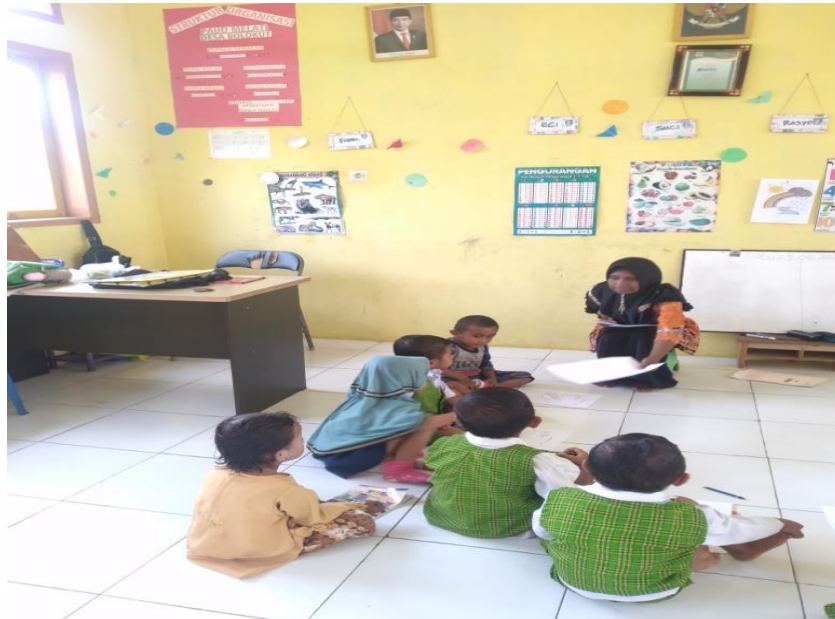
Gambar : Pembagian Lembaran Kerja Siswa (Sketsa Gambar)