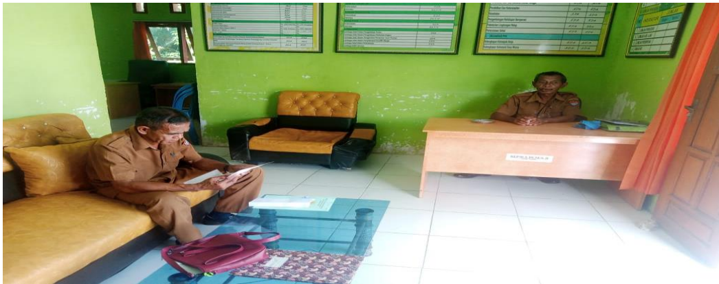
Gambar : Ruang Kantor Desa Bolokut