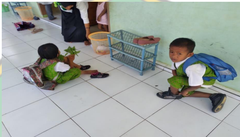
Gambar : Kegiatan Anak Memakai Sepatu Ketika Pulang Sekolah