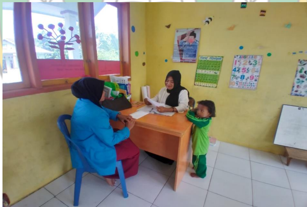
Gambar : Data Ruangan Kantor Desa Bolokut