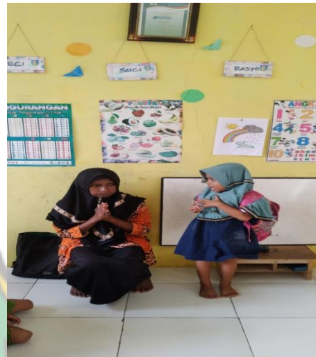
Gambar : Anak Menyanyi di Depan Kelas