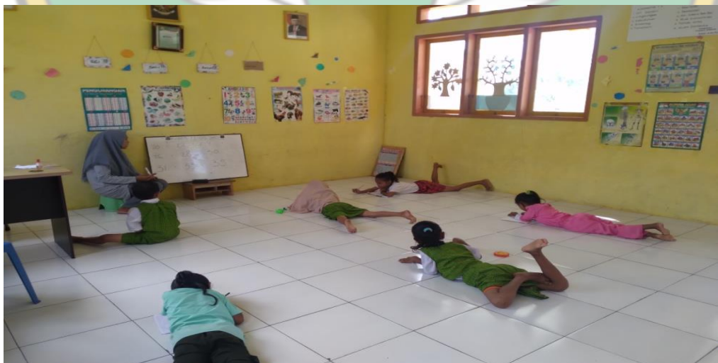
Gambar : Kegiatan Belajar Mengajar di Dalam Kelas