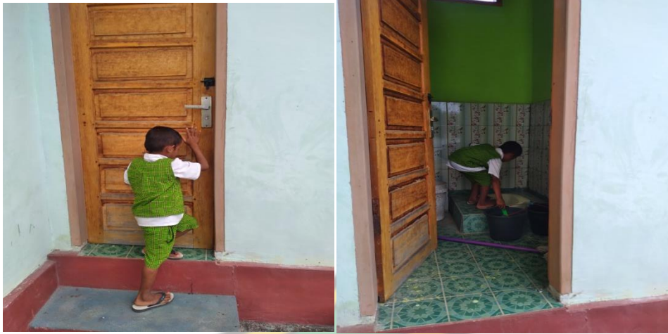
Gambar : Kegiatan Anak Pada Saat Menggunakan Toilet Sendiri