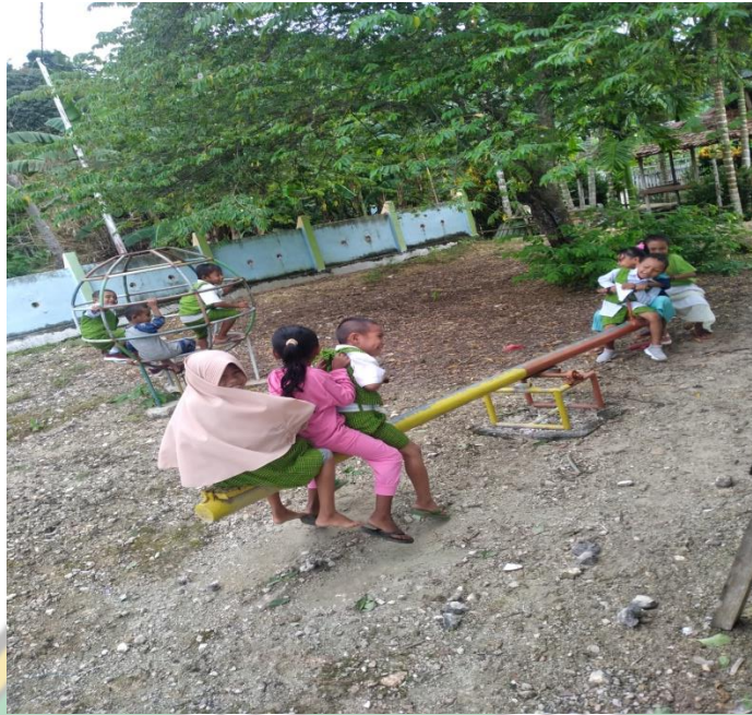
Gambar : Kegiatan Anak Bermain Bersama