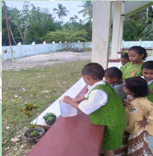
Gambar : Kegiatan Anak Mencuci Tangan Sebelum Makan