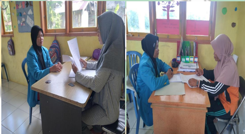
Gambar : Wawancara dengan Guru PAUD Melati Bolokut