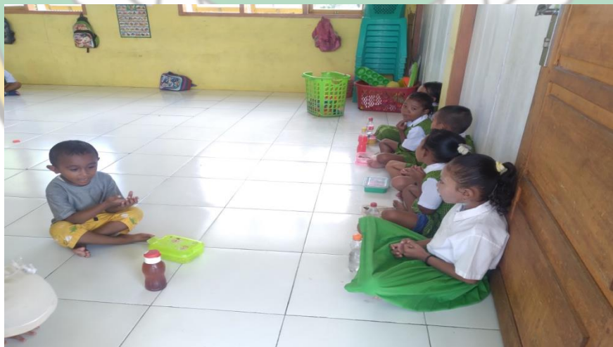
Gambar : Kegiatan Istrahat Makan Bersama