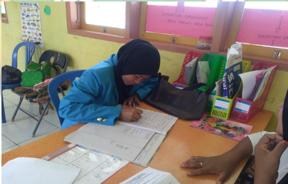
Gambar : Mengisi Data