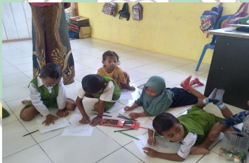
Gambar : Kegiatan Anak Sedang Mewarnai Sketsa Gambar