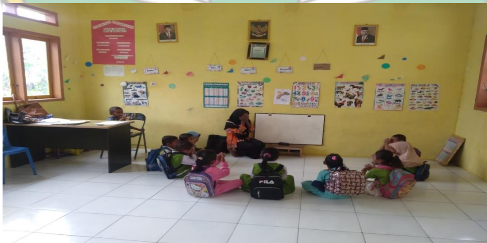
Gambar : Kegiatan Anak Berdo'a Bersama Ketika Hendak Mau Pulang Sekolah