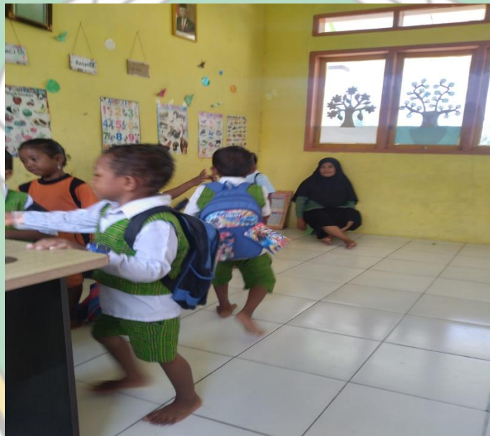
Gambar : Kegiatan Salaman Kepada Guru Ketika Pulang Sekolah