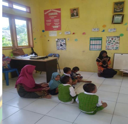
Gambar : Kegiatan Anak Berdo'a Sebelum Memulai Pembelajaran