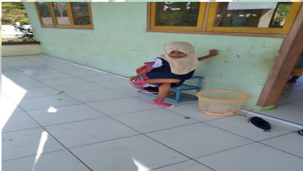
Gambar : Anak Membuka Sepatunya Sendiri