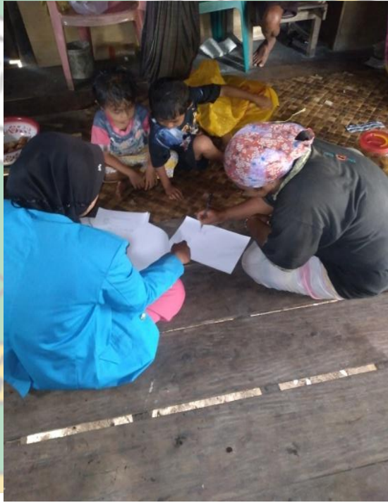
Gambar : Wawancara dengan Orangtua Anak Desa Bolokut