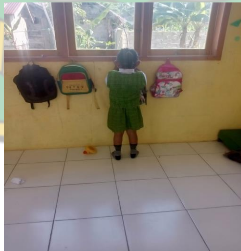
Gambar : Anak Menggantungkan Tasnya Sendiri