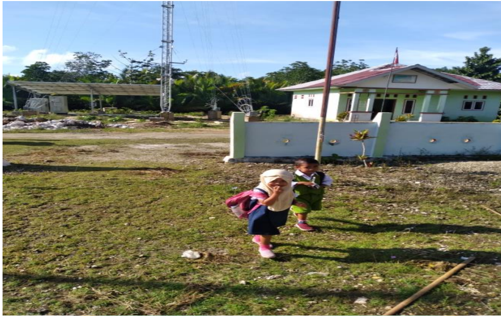
Gambar : Anak Pada Saat Datang Kesekolah Sendiri