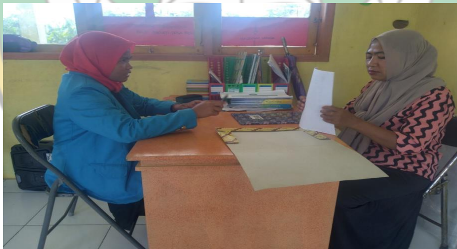
Gambar : Pemberian Surat Izin Selesai Meneliti dari Kepala Sekolah PAUD Melati Bolokut Kepada Saudari Peneliti