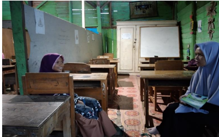
Wawancara dengan keluarga klien