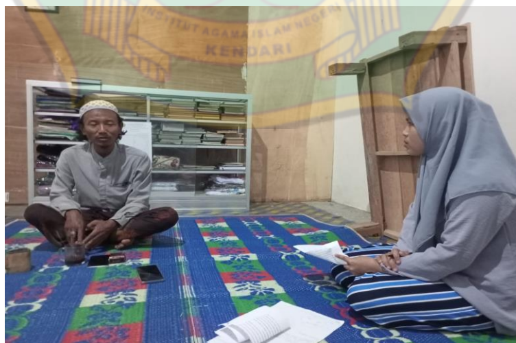
Wawancara dengan peruyyah oleh ustdz afandi