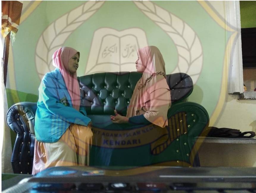
Wawancara dengan ibu MA