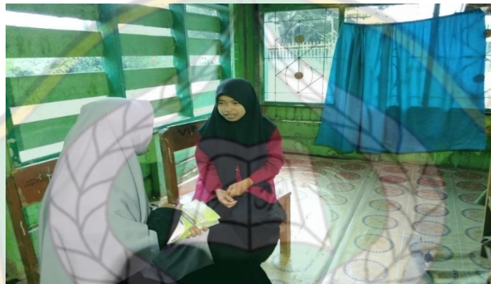
Wawancara dengan keluarga klien