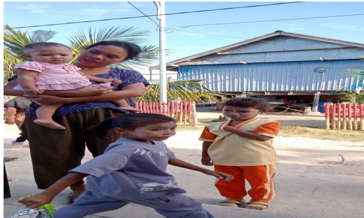
Gambar: dokumentasi orang tua yang mengantar anaknya tetapi anaknya yang tidak mau ditinggal