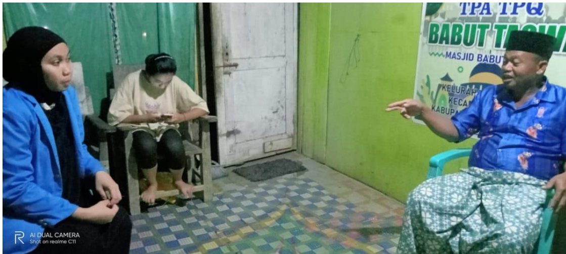
Gambar 1 wawancara dengan pak imam di kecamatan loea terkait kawin lari tanggal 19 september 2022