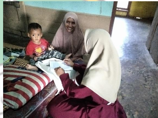
Gambar: 5.2 Wawancara bersama masyarakat SP 4