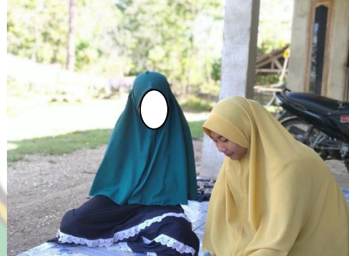
Gambar: 5.1 Wawancara bersama Pelaku Wanita Pernikahan Usia Dini di SP 4