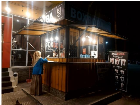
Gambar wawancara dengan risma pegawai boba box