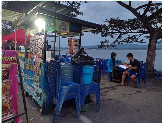
Gambar wawancara dengan ibeng pemilik kedai adam fakhi