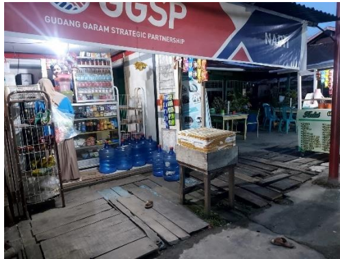
Gambar wawancara dengan bapak kadir pemilik warung dan kedai ulfa