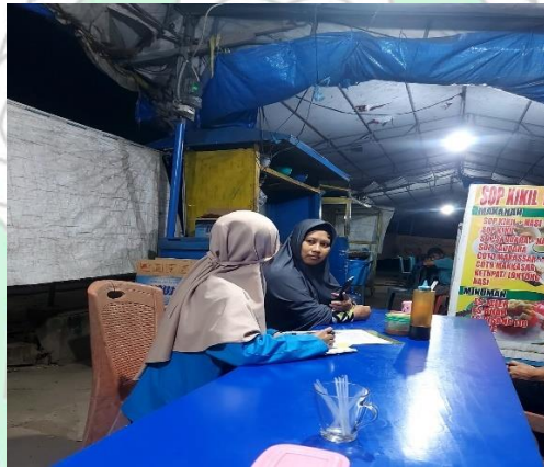
Gambar wawancara dengan ibu santri pemilik usaha sop kikir