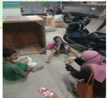
Dok: Wawancara dengan anak jalanan/pekerja anak dibawah umur