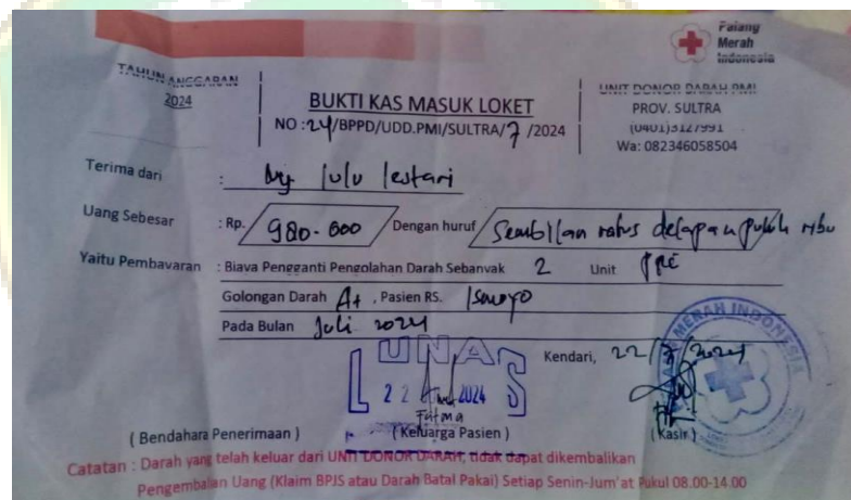
Gambar 4.2 Kwitans

Berdasarkan hasil wawancara di atas dapat disimpulkan bahwa perjanjian antara UTD PMI dan resipien bisa diketahui sebelum adanya permintaan ke UTD PMI, karena dikonfirmasi langsung juga melalui perawat atau dokter dari Rumah Sakit pasien dirawat, dengan adanya kesepakatan resipien bersedia dan rela dengan biaya pengganti pengolahan darah, dibuktikan dengan bukti kwintansi pembayaran.