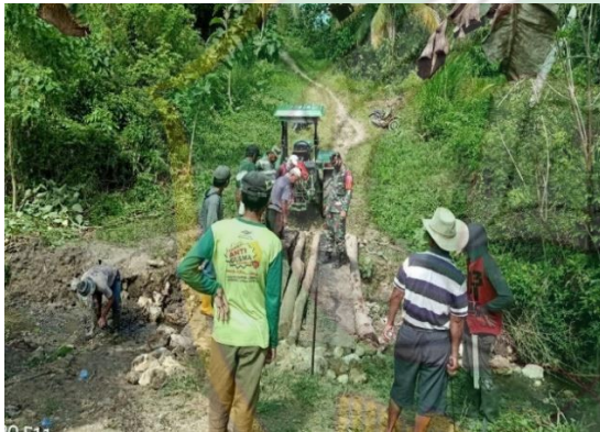
Kegiatan gotong royong perbaikan jalan ke kebun warga yang dibina langsung oleh BABINSA