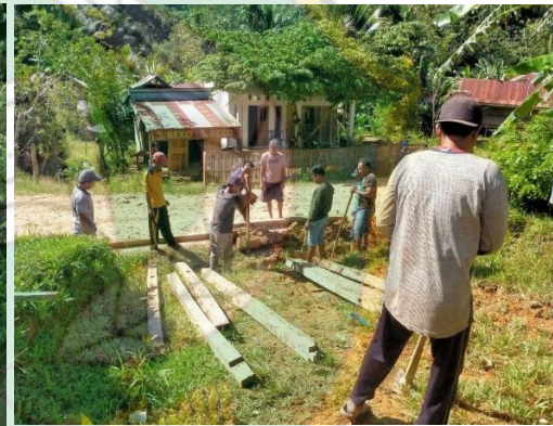
Kegiatan gotong royong, membantu tetangga dalam pembuatan warung sembako