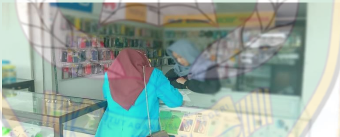
Proses wawancara inisial "E" pada tanggal 20 Juni 2022, bersama karyawan counter XIII