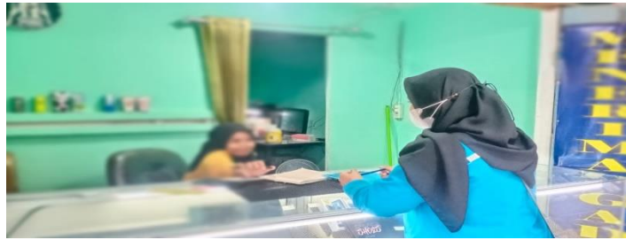
Proses wawancara inisial "Ol" pada tanggal 20 Maret 2022, bersama karyawan counter III