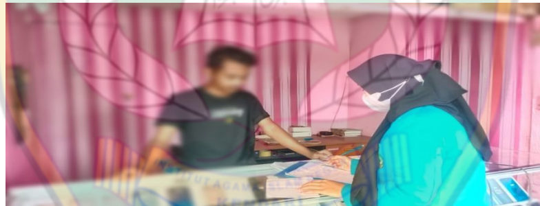
Proses wawancara inisial "Ra" pada tanggal 20 maret 2022, bersama karyawan counter V