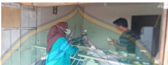
Proses wawancara inisial "M" pada tanggal 11 Juni 2022, bersama pemilik counter XII