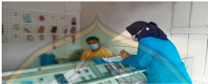
Proses wawancara inisial "Ád" pada tanggal 20 Maret 2022, bersama karyawan counter IV