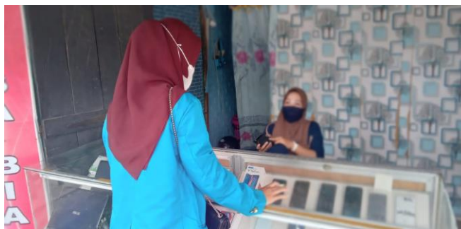
Proses wawancara inisial "D" pada tanggal 20 maret 2022, bersama karyawan counter XI