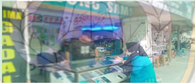
Proses inisial "Ip" wawancara pada tanggal 11 Maret 2022, bersama pemilik counter 1