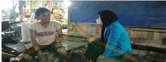
Proses wawancara pada tanggal 11 Maret 2022, bersama bapak Pengelola Pasar Panjang