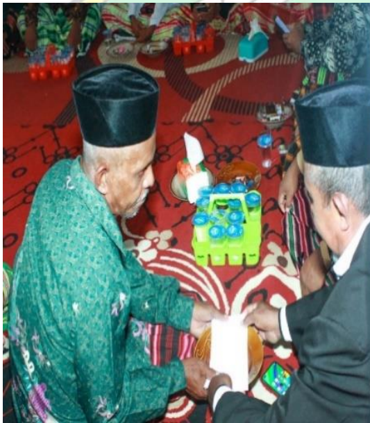
Doc. : Penyerahan Kafeena, Kataburi, dll pongke