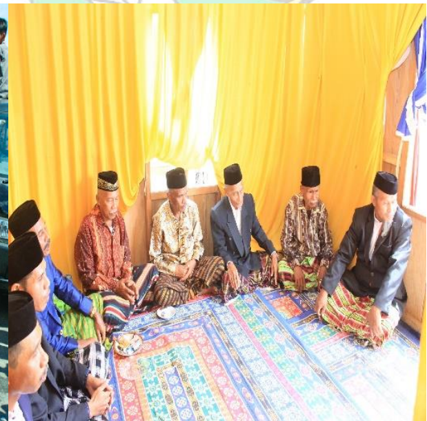
Doc. : Delegasi Adat