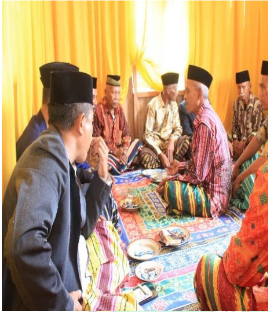
Doc. : Dohendegho Fetapa