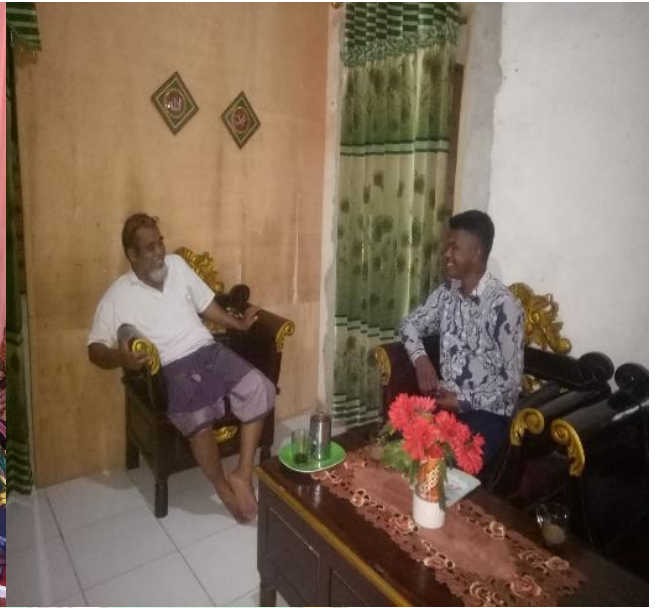
Doc : Wawancara dengan Bapak Ld. Sastrawan