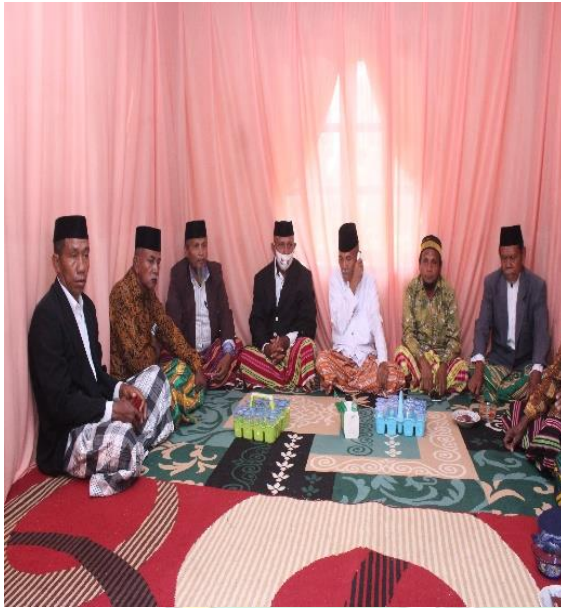
Doc. : Delegasi Adat Laki-laki S.T