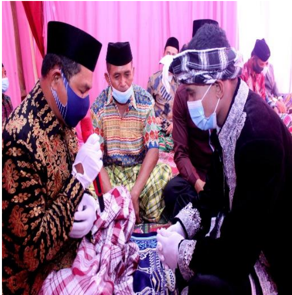
Doc. : Akad Nikah