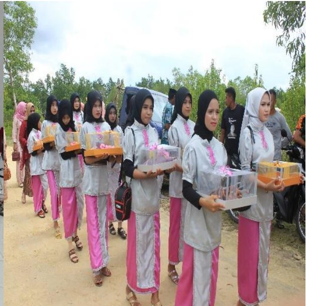
Doc. : Bawa Pinangan