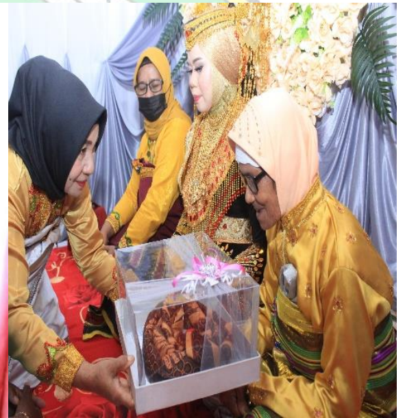
Doc. : Penyerahan cincin kabhentano