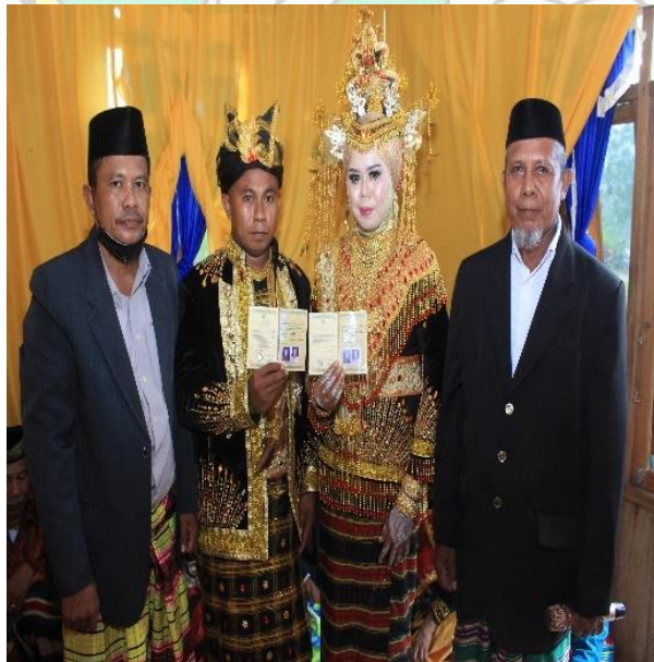
Doc. : Penyerahan Buku Nikah