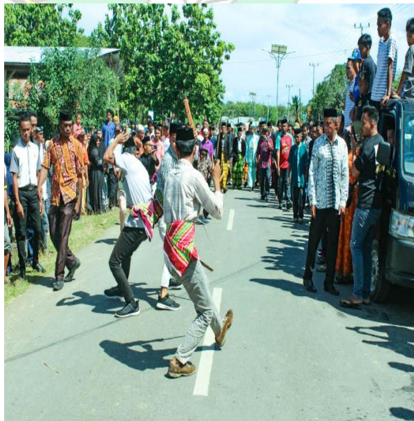
Doc. : Silat Muna Pengantar Pengantin Laki-Laki