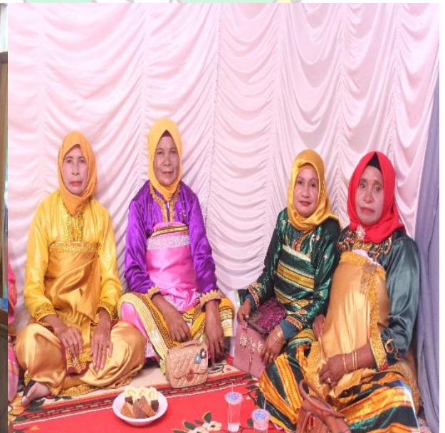
Doc. : Delegasi Adat Perempuan