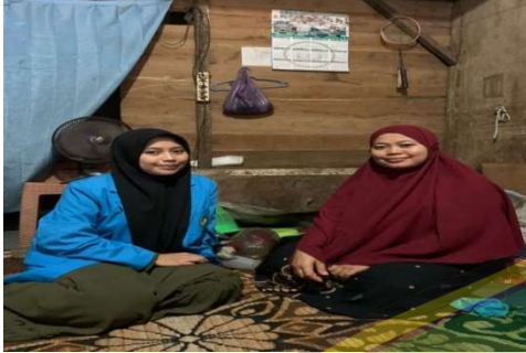
Gambar 1 Wawancara bersama ibu SU