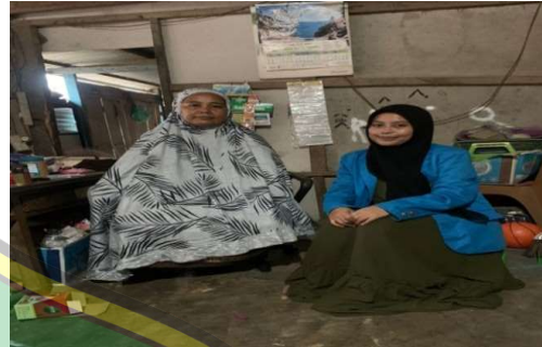
Gambar 2 Wawancara bersama ibu NU