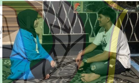
Gambar 4 Wawancara Bersama AG