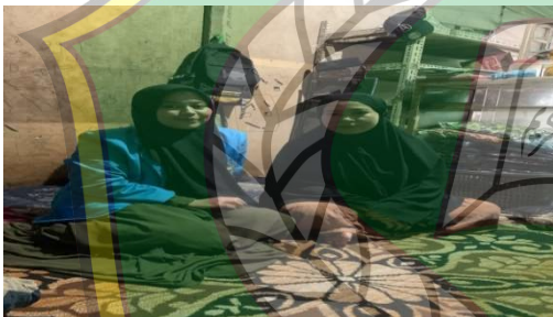
Gambar 3 Wawancara bersama ibu IN