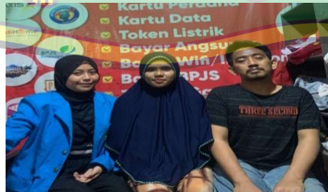
Gambar 5 Wawancara bersama ibu AA dan bapak MN