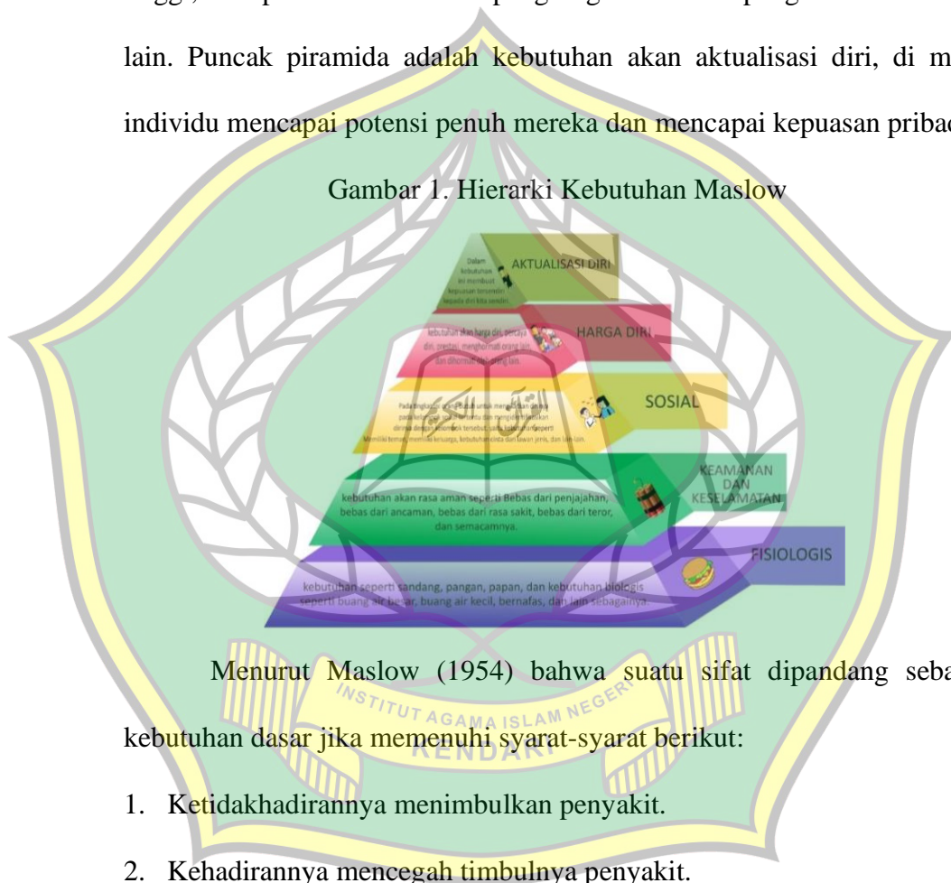
Gambar 1. Hierarki Kebutuhan Maslow

Menurut Maslow (1954) bahwa suatu sifat dipandang sebagai kebutuhan dasar jika memenuhi syarat-syarat berikut: