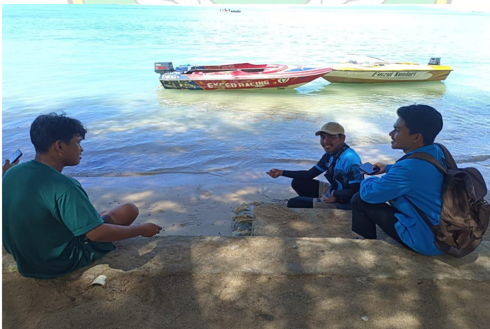
Gambar 8: Proses pengambilan data (Wawancara) kepada salah satu pelaku usaha sarana hiburan dalam kawasan pariwisata.