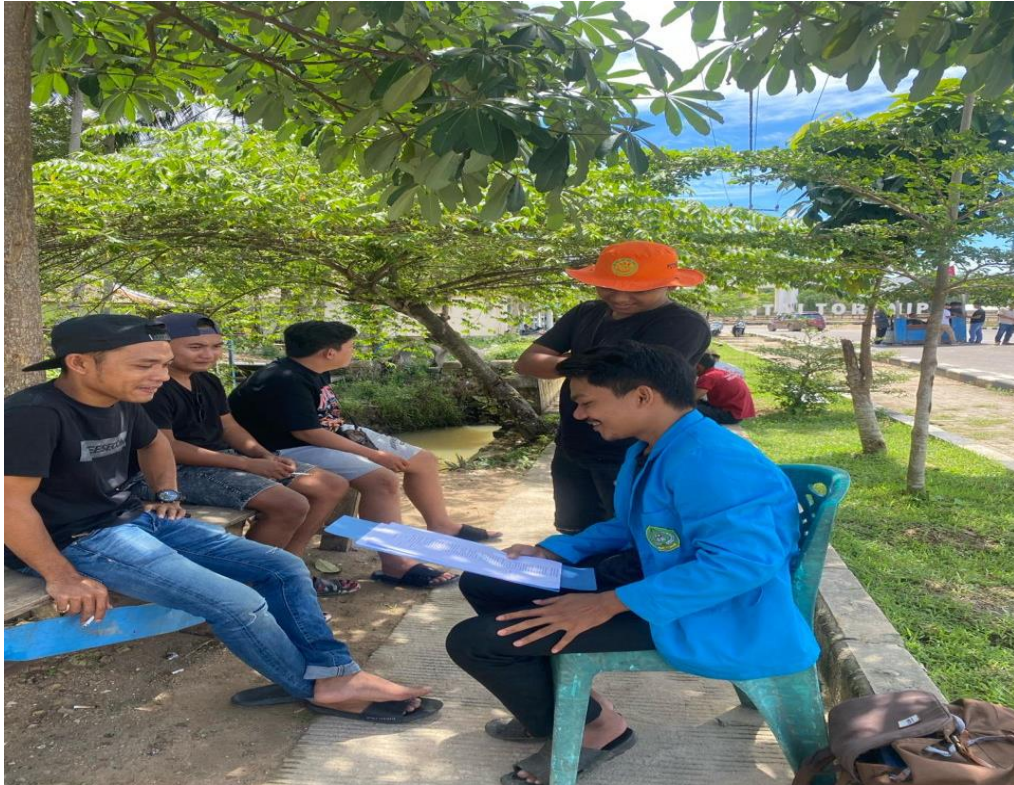
Gambar 4: Proses Pengambilan data (wawancara) kepada salah satu tokoh Masyarakat lokal