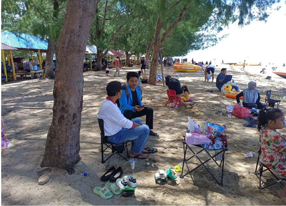
Gambar 5: Proses wawancara pada salah satu pengelola pariwisata