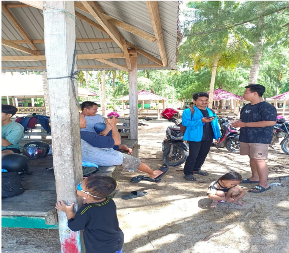
Gambar 7: Proses wawancara kepada salah satu Wisatawan.