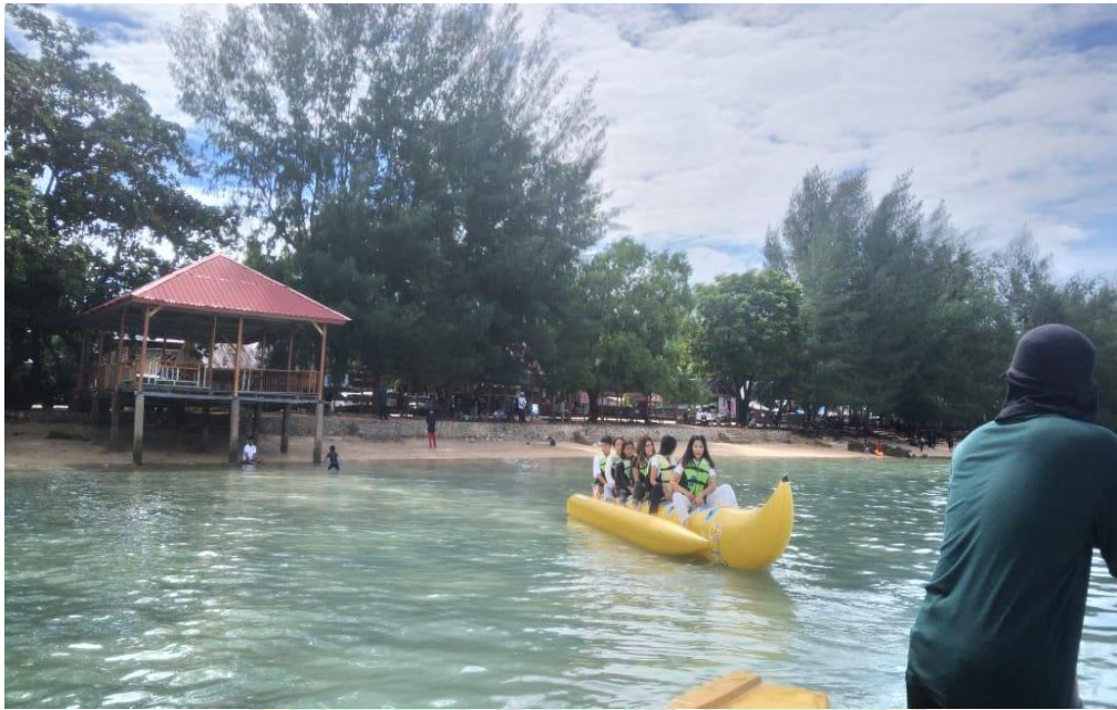
Gambar 9: Sarana hiburan