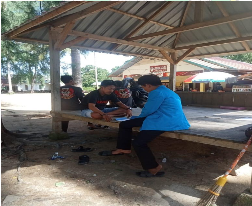
Gambar 6: Proses wawancara pada salah satu pelaku usaha di dalam area pariwisata Pantai Toronipa