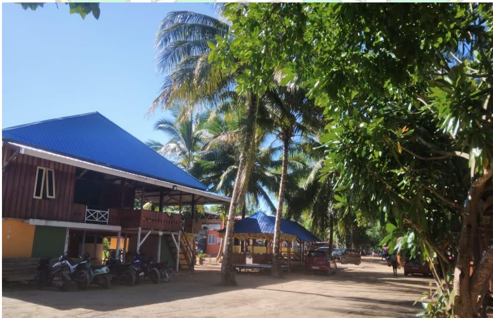
Gambar 10: Fasilitas sarana (Villa & Gazebo) di dalam Kawasan Pariwisata Pantai Toronipa