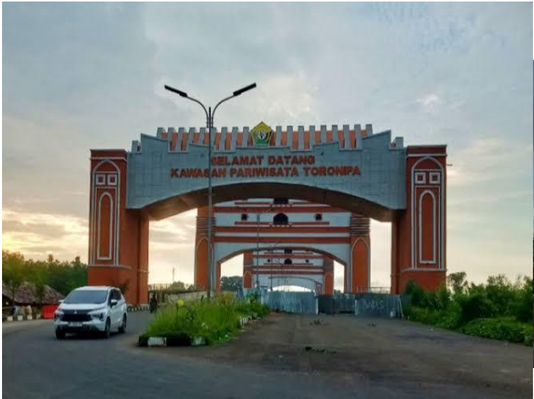
Gambar 1: Gerbang Utama & Jalan Tol Kawasan Pariwisata