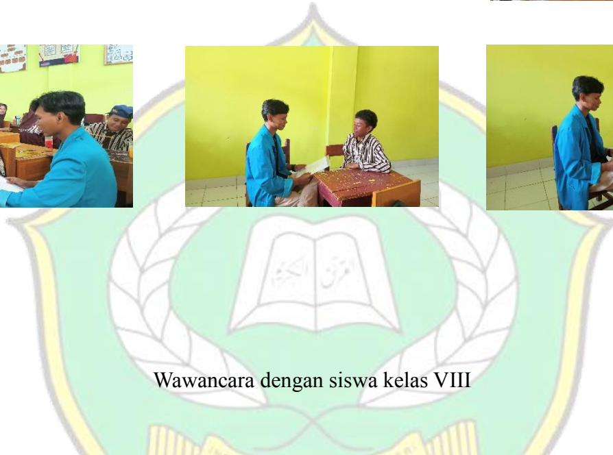
Wawancara dengan siswa kelas VIII