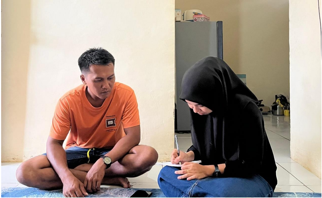
Gambar 4 Dokumentasi Wawancara Awal Selaku Petani Di Kelurahan Ladongi