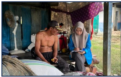
Gambar 5 Wawancara bersama bapak U selaku petani di Kelurahan Ladongi