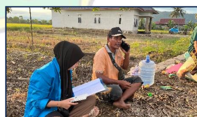
Gambar 10 Wawancara bersama bapak C selaku pedagang (pemberi modal) di Kelurahan Ladongi