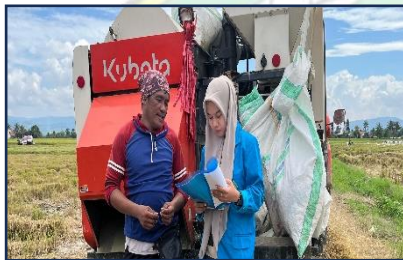
Gambar 7 Wawancara bersama bapak M selaku petani di Kelurahan Ladongi