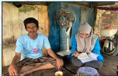
Gambar 8 Wawancara bersama bapak A selaku petani di Kelurahan Ladongi