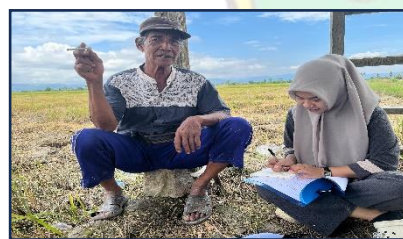
Gambar 9 Wawancara bersama bapak K selaku petani di Kelurahan Ladongi