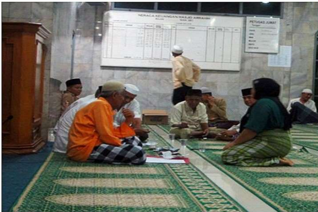
Proses pembayaran zakat oleh muzakki kepada amil zakat di Masjid Nurul Huda Kelurahan Tinanggea