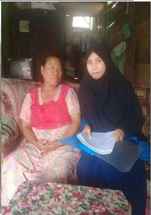
Wawancara dengan amil zakat dan Mustahiq zakat