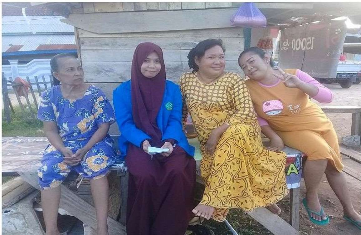
Wawancara dengan muzakki dan mustahiq zakat