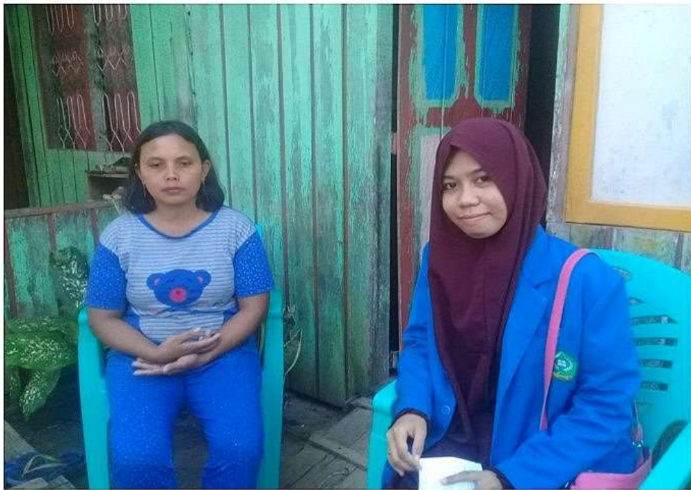
Wawancara dengan Mustahiq dan Muzakki