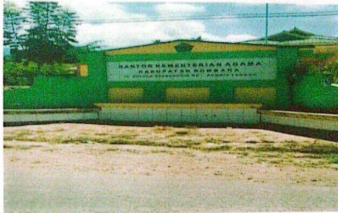
Kantor Kementerian Agama Kabuapten Bombana