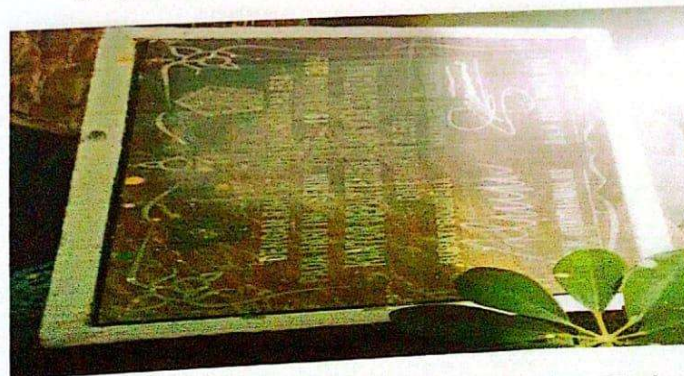
Peresmian Perubahan Nama Kantor Departemen Agama Kabupaten Bombana