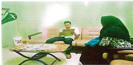
wawancara dengan tata usaha