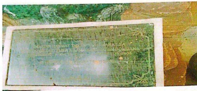
Peresmian Kantor Departemen Agama Kabupaten Bombana