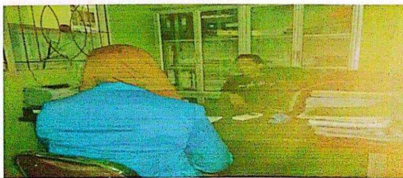
Wawancara dengan kepala seksi haji