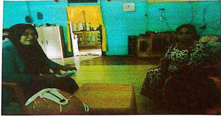
Wawancara dengan jama'ah haji 2017