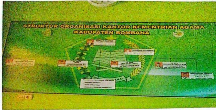
Struktur Organisasi Kantor Kementerian Agama Kabupaten Bombana