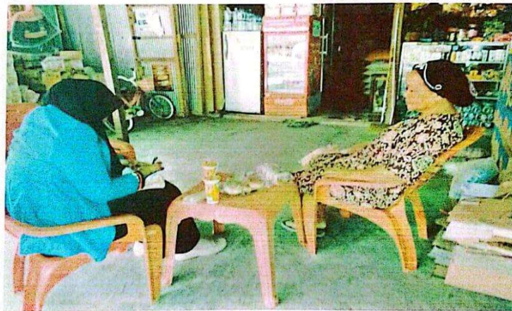
Wawancara dengan jama'ah haji 2017