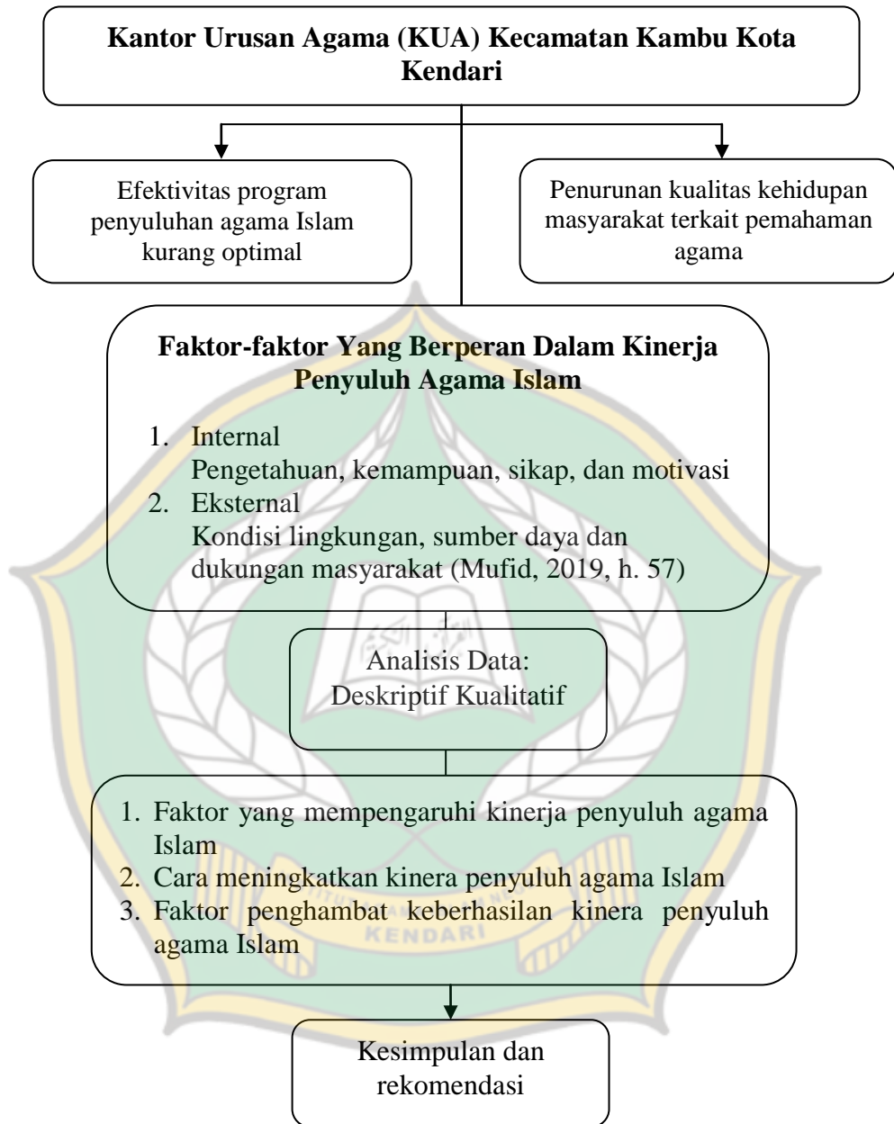
Gambar 2.1. Kerangka Pikir: Faktor-faktor Yang Berperan Dalam Kinerja Penyuluh Agama Islam di Kantor Urusan Agama (KUA) Kecamatan Kambu Kota Kendari