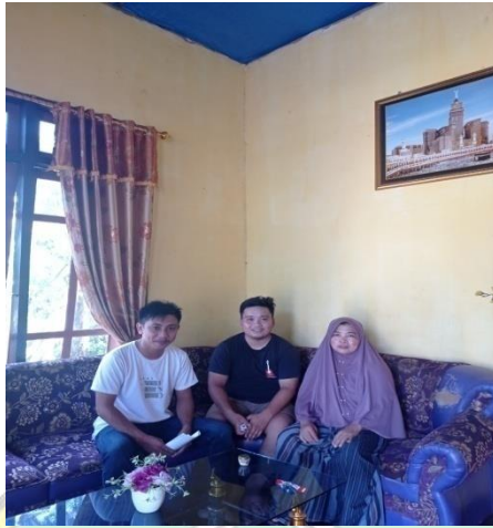
Wawancara ibu N dan anaknya AF