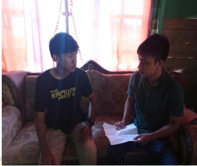
Wawancara dengan TD