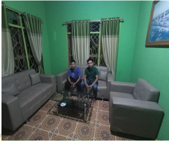
Wawancara dengan IR