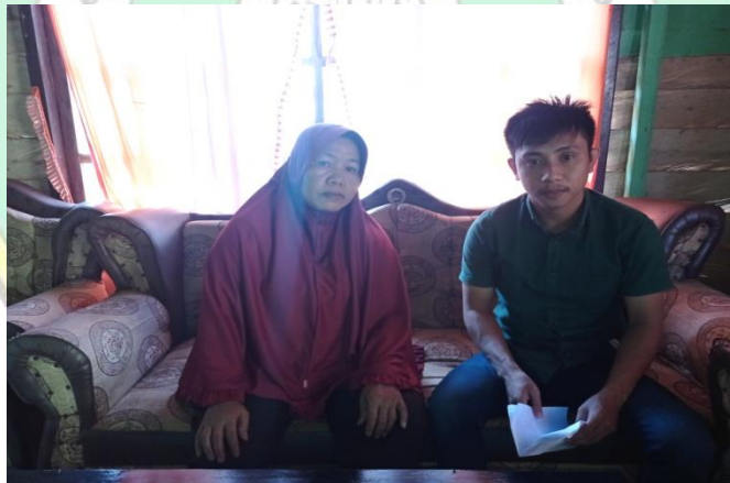
Wawancara dengan ibu R orang tua dari TD