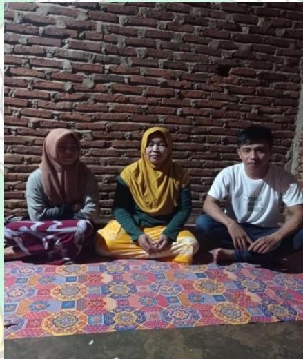
Wawancara ibu H dan anaknya T