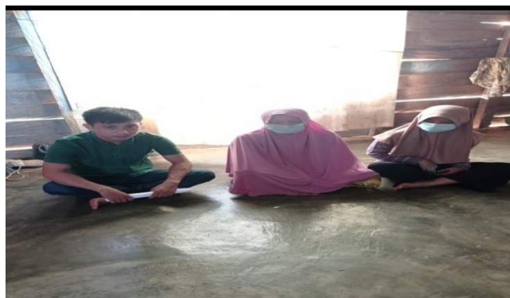
Wawancara dengan ibu S dan anaknya EP