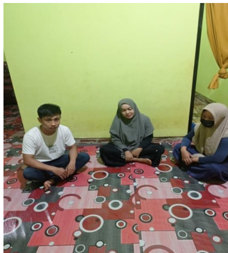
Wawancara ibu D dan anaknya E