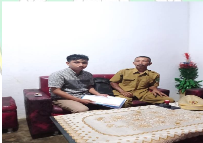
Wawancara Dengan Kepala Desa Mokaleleo