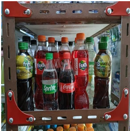
Produk: Fanta dan Coca cola