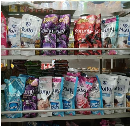
Produk: Molto dan Downy