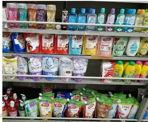
Produk: sabun Lifebuoy dan sabun Dove