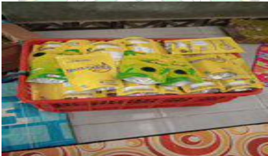
Proses Pengemasan Produk Keripik Pisang Zunana Chips