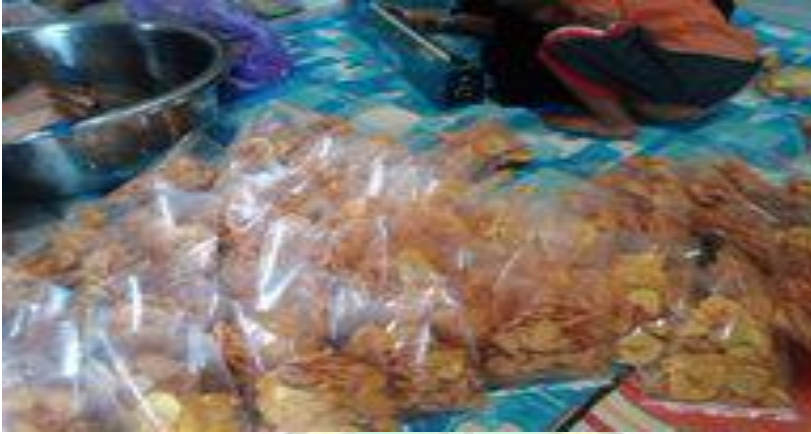
Pengemasan Keripik Pisang Zunana Chips