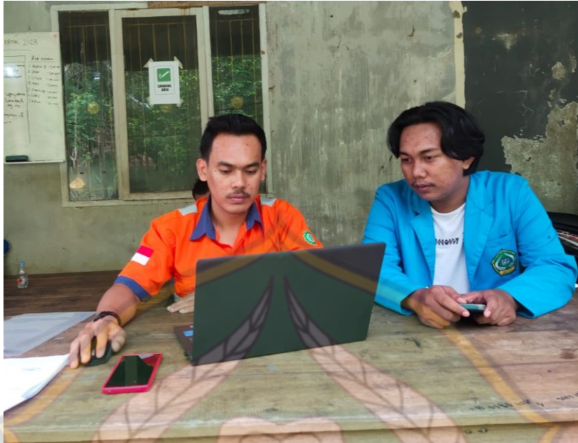
Gambar 1 Wawancara Bersama dengan Ketua Corporate Social Responsibility (CSR) PT Ceria Nugraha Indotama (CNI)