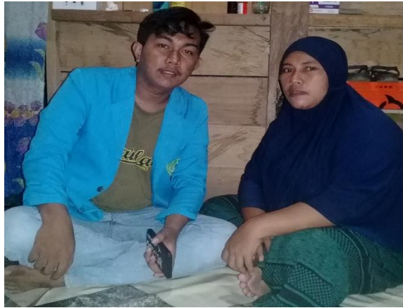
Gambar 11 Orang Tua Penerima Beasiswa