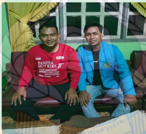
Gambar 7 Wawancara Bersama Kepala Dusun II Desa Tolowe Ponre Waru