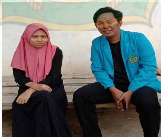
Gambar 13 Penerima Beasiswa Tingkat SMA/MA