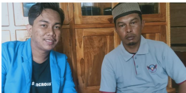
Gambar 8 Wawancara Bersama Kepala Dusun I Desa Tolowe Ponre Waru