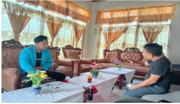
Gambar 3 Wawancara bersama Kepala Desa Tolowe Ponre Waru