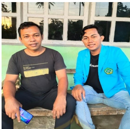
Gambar 6 Wawancara Bersama Kepala Dusun III Desa Tolowe Ponre Waru