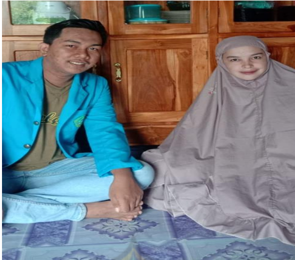
Gambar 9 Guru TK Muhammadiyah Tolowe Ponre Waru