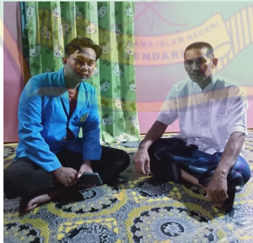
Gambar 5 Wawancara bersama Kepala Dusun IV Desa Tolowe Ponre Waru