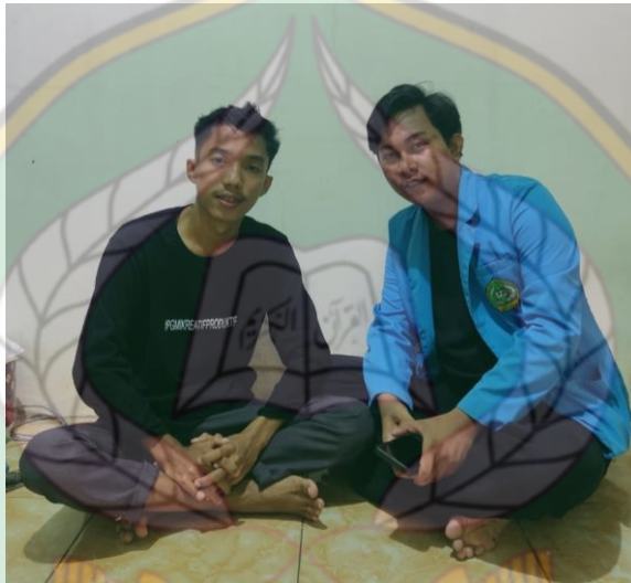
Gambar 12 Penerima Beasiswa Tingkat Perguruan Tinggi