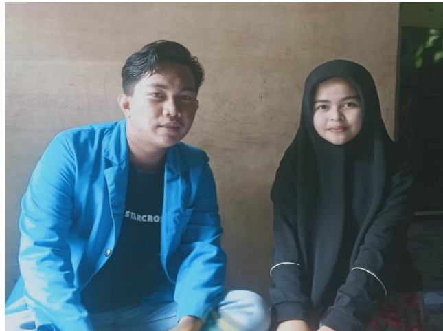
Gambar 14 Penerima Beasiswa Tingkat SMP/MTS