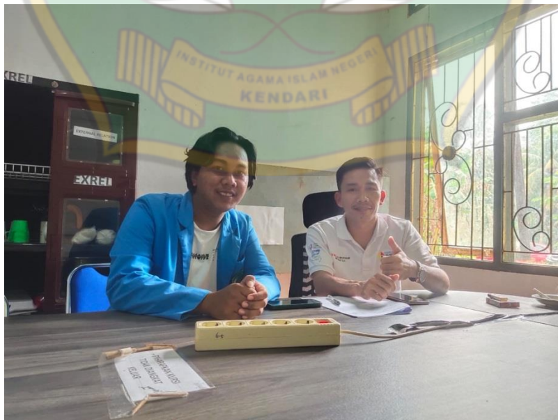
Gambar 2 Wawancara bersama Anggota Divisi Corporate Social Responsibility (CSR) PT Ceria Nugraha Indotama (CNI)