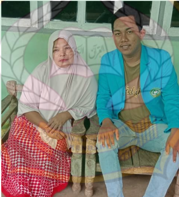
Gambar 10 Orang Tua Penerima Beasiswa