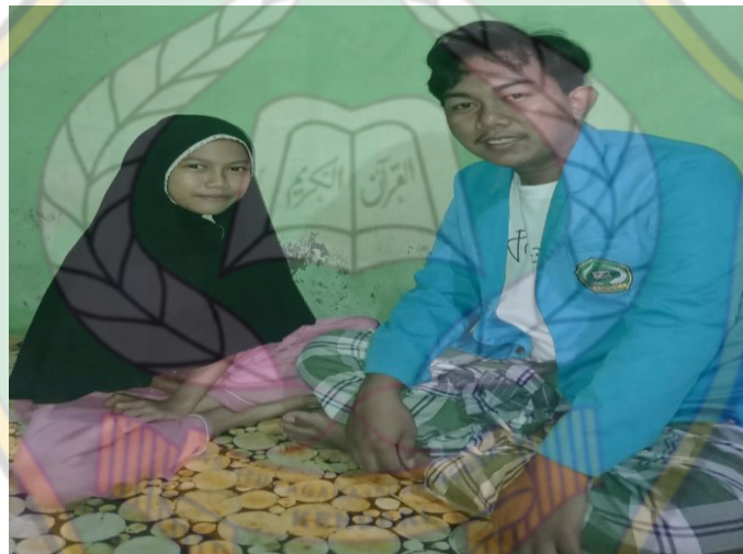
Gambar 15 Penerima Beasiswa Tingkat SD/MI