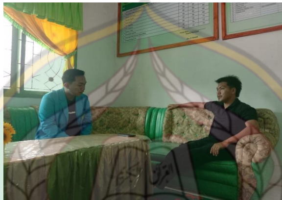
Gambar 4 Wawancara bersama Sekretaris Desa Tolowe Ponre Waru