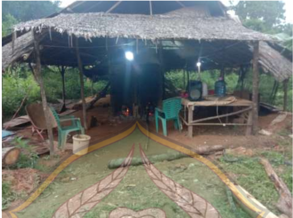
Gambar 15: Proses pembakaran untuk menghasilkan batu bata merah