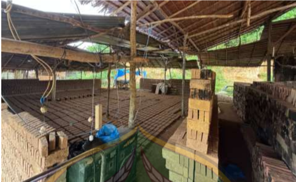
Gambar 13: keadaan bangsal tampak dari dalam