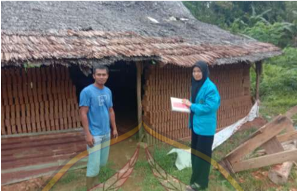
Gambar 7: Peneliti sedang melakukan wawancara kepada bapak AA (pemilik bangsal ke-4)