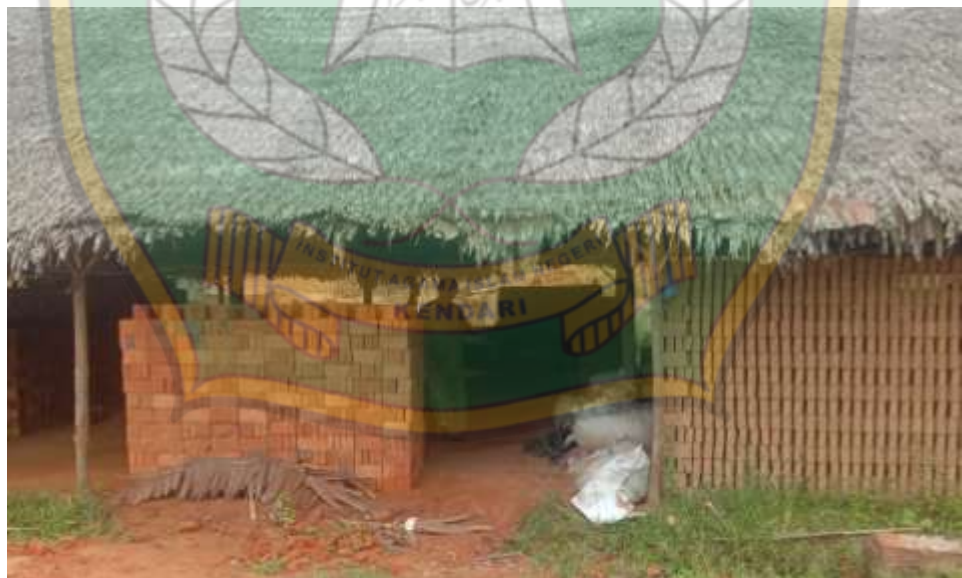
Gambar 16: Batu bata merah yang siap dijual kepada pembeli