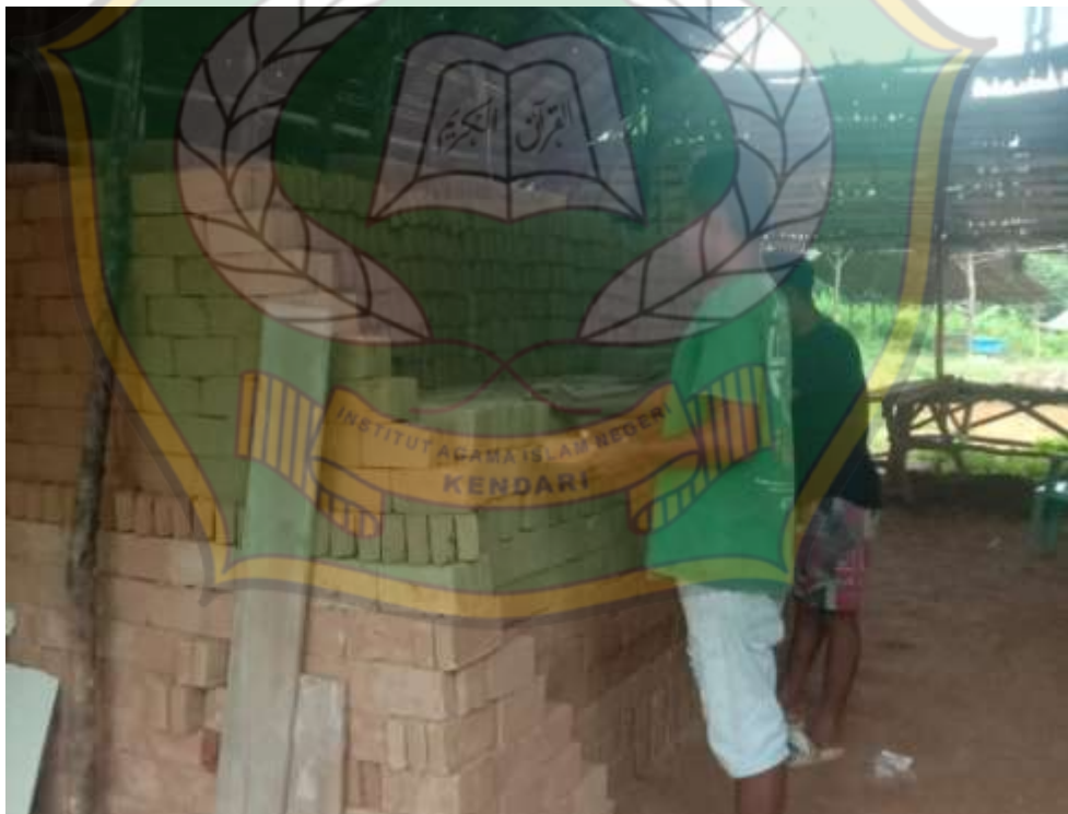
Gambar 14: Penyusunan batu bata kering sebelum dilakukan pembakaran