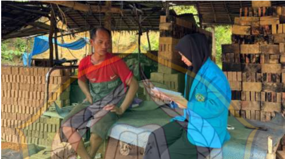
Gambar 1: Peneliti sedang melakukan wawancara kepada bapak SG (pemilik bangsal ke-1).