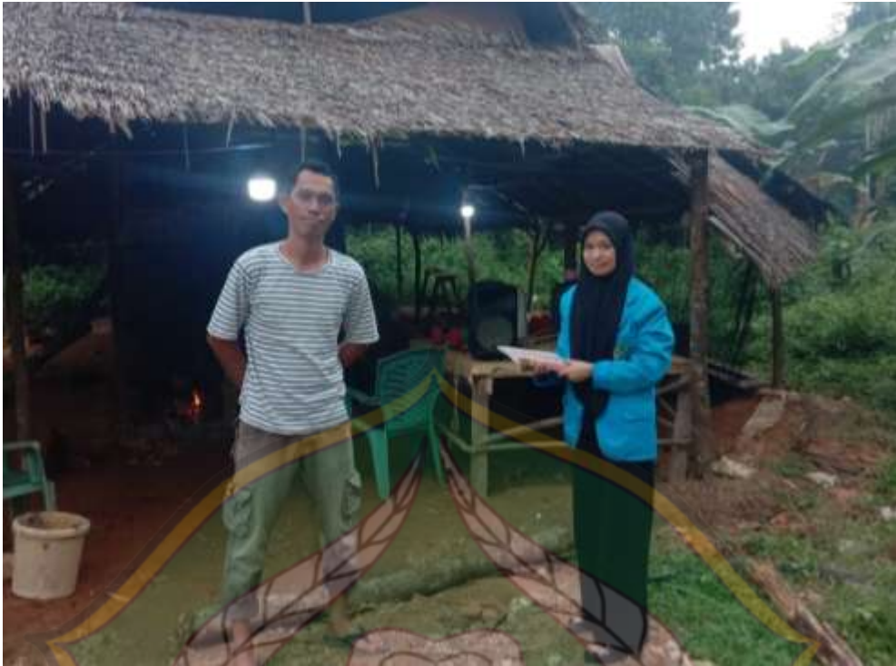
Gambar 9: Peneliti sedang melakukan wawancara kepada bapak AG (pemilik bangsal ke-5)