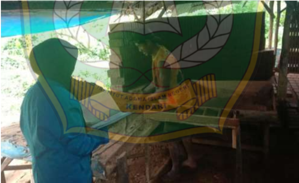
Gambar 8: Peneliti sedang melakukan wawancara kepada bapak RZ, beliau merupakan pekerja dari bapak AA.