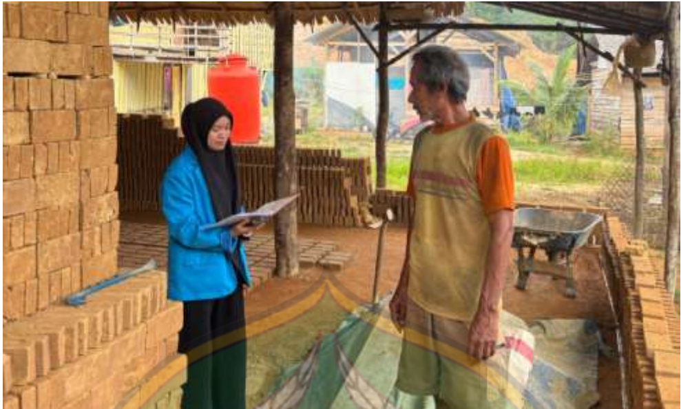
Gambar 3: Peneliti sedang melakukan wawancara kepada bapak BA (pemilik bangsal ke-2).