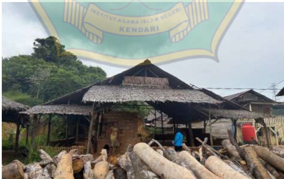
Gambar 12: keadaan bangsal tampak dari depan