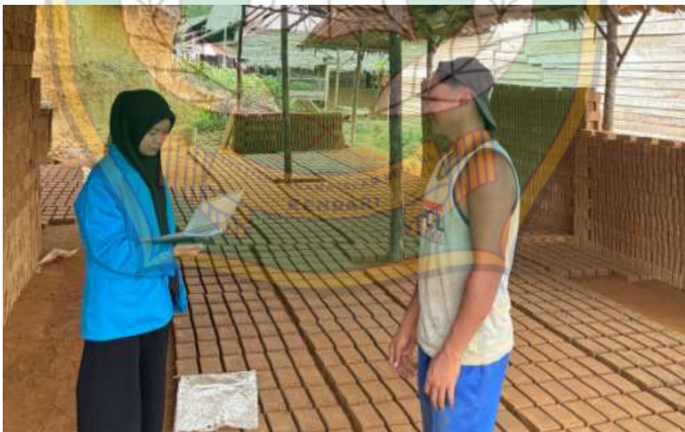
Gambar 4: Peneliti sedang melakukan wawancara kepada bapak RW beliau merupakan pekerja dari bapak BA