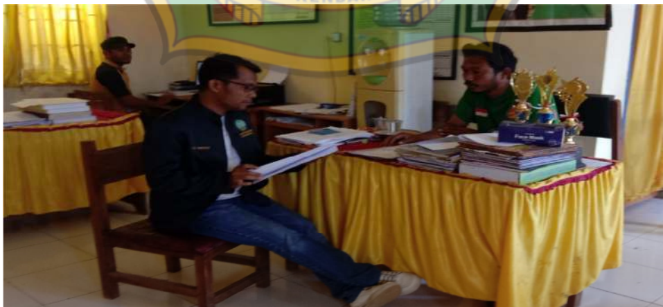
Gambar: Pelaksanaan Pengambilan Data Penelitian Sekolah Dasar Negeri di Kabupaten Muna