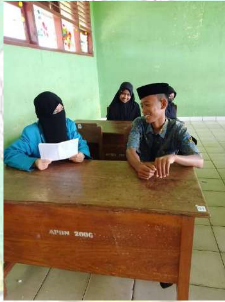
مقابلة مع ألفتان