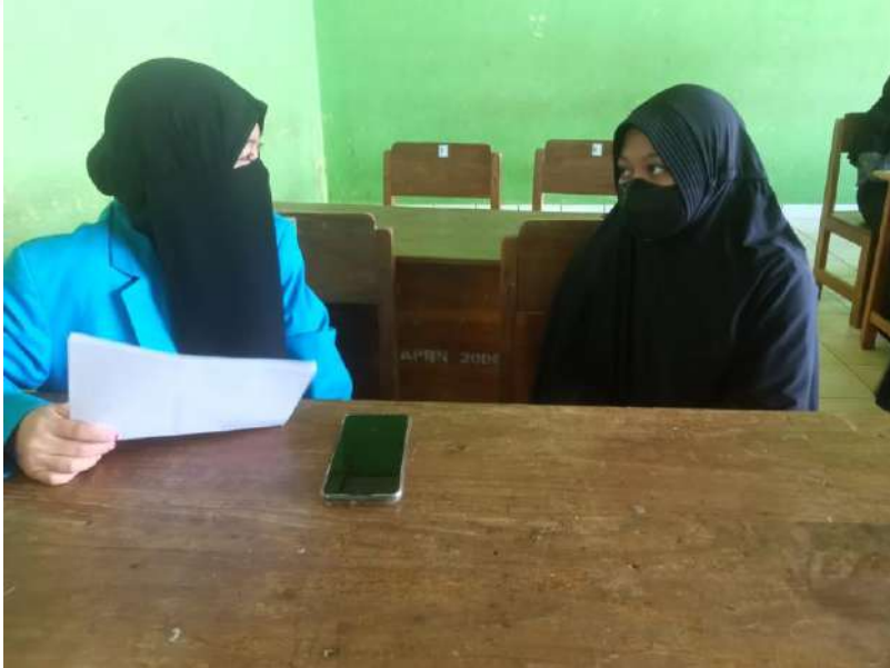
مقابلة مع شهريني