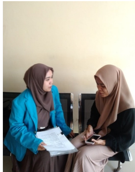
mahasiswa fakultas syariah prodi Hukum Ekonomi Syariah