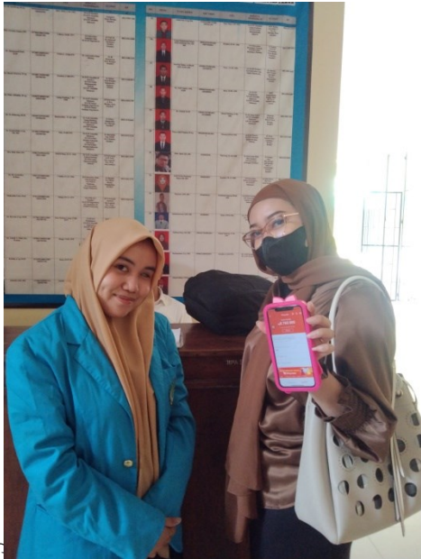
Gambar 1 wawancara dengan mahasiswa fakultas syariah prodi Hukum Ekonomi Syariah