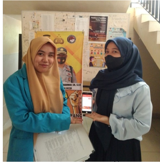
mahasiswa Fakultas KPI prodi FUAD