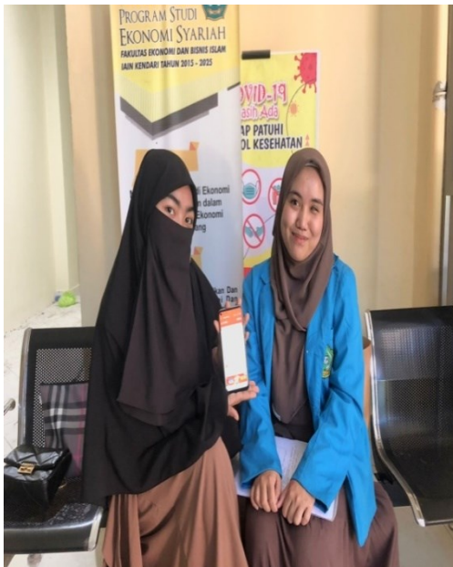
Bisnis prodi Perbankan Syariah