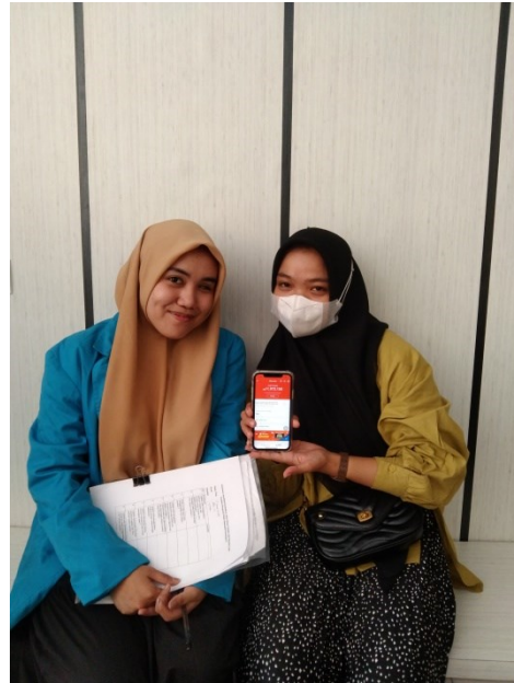
Gambar 2 wawancara dengan mahasiswa fakultas syariah prodi Hukum Keluarga Islam