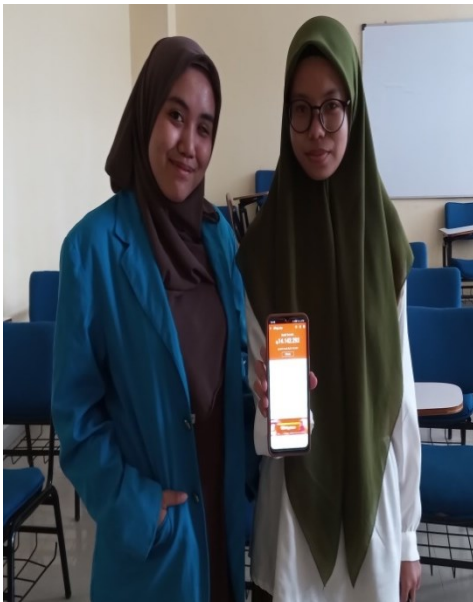
mahasiswa fakultas syariah prodi Hukum Ekonomi Syariah