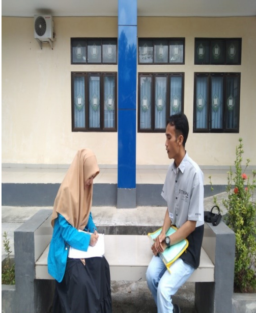
Gambar 5 wawancara dengan mahasiswa Fakultas Ekonomi dan Bisnis prodi Perbankan Syariah