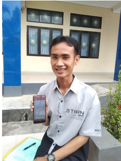
Gambar 6 dokumentasi dengan fitur shopee paylater