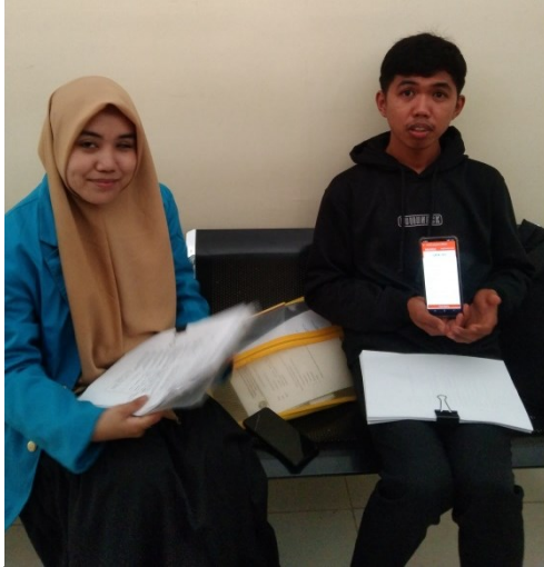
Gambar 9 wawancara dengan mahasiswa Fakultas Ekonomi dan Bisnis prodi Perbankan Syariah