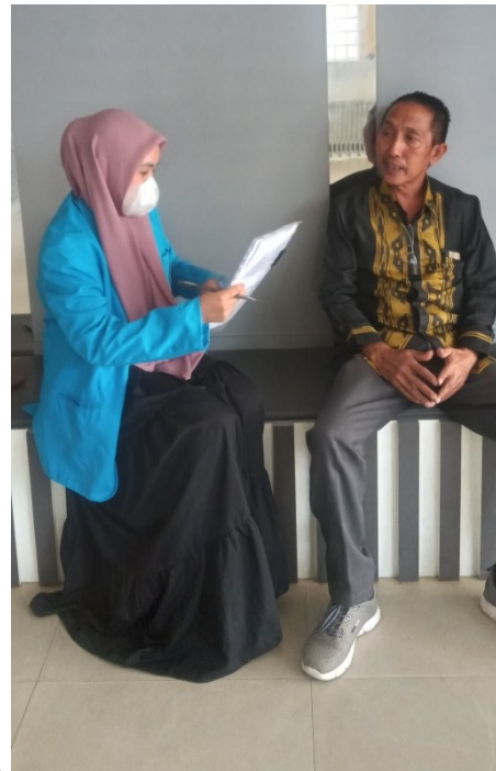
Gambar 13 dengan kepala kabag. Akademik dan kemasasiswaan Institut Agama Islam Negeri Kendari