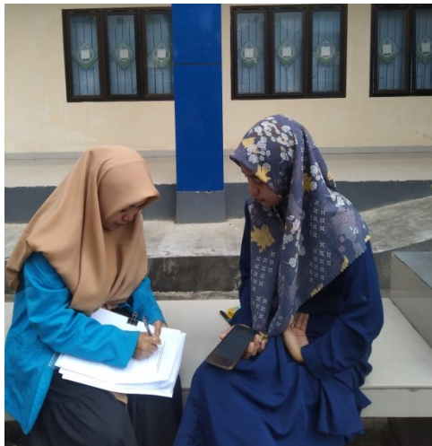
mahasiswa Fakultas Ekonomi dan Bisnis prodi Perbankan Syariah