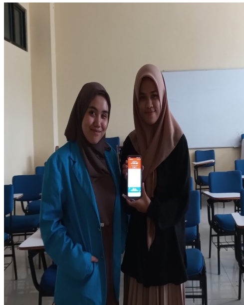
mahasiswa fakultas syariah prodi Hukum Ekonomi Syariah