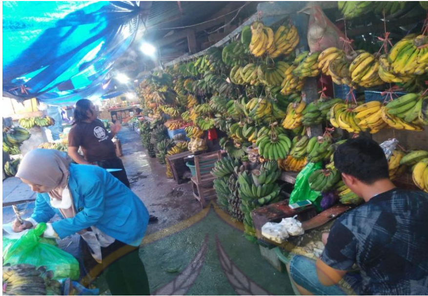
Proses wawancara pada tanggal 1 Juli 2022, bersama Pedagang Buah IV di Pasar Baruga