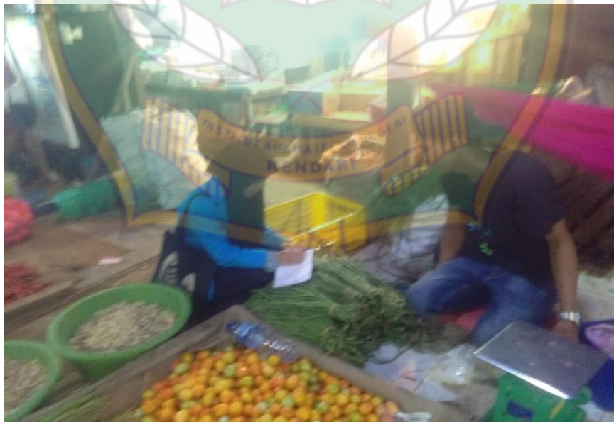
Proses wawancara pada tanggal 1 Juli 2022, bersama Pedagang Sayur III di Pasar Baruga