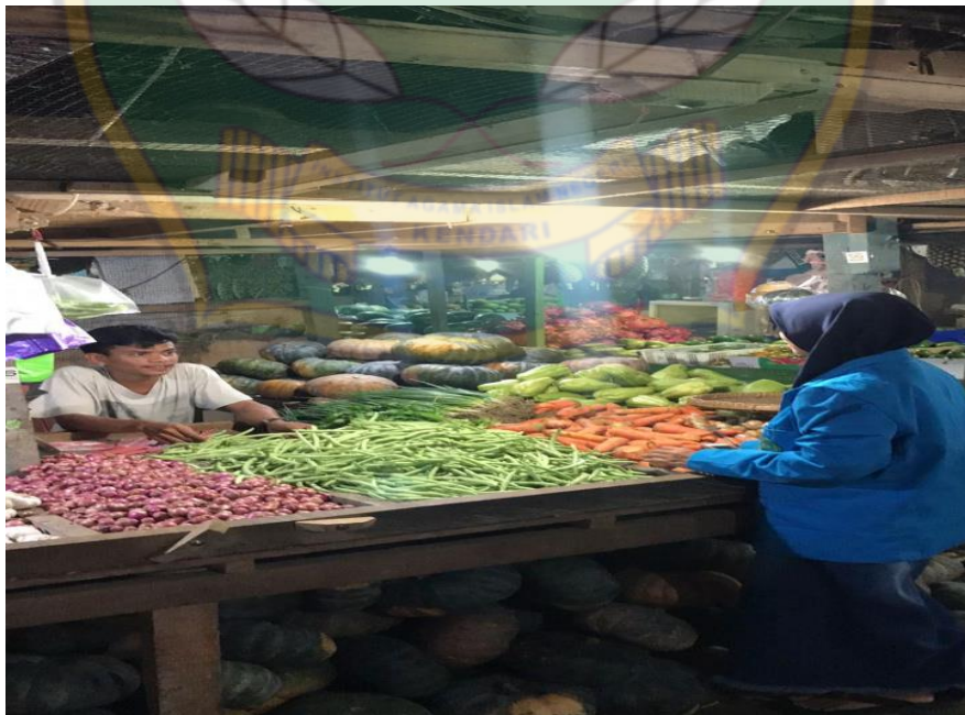
Proses wawancara pada tanggal 2 Juli 2022, bersama Pedagang Sayur IX di Pasar Baruga