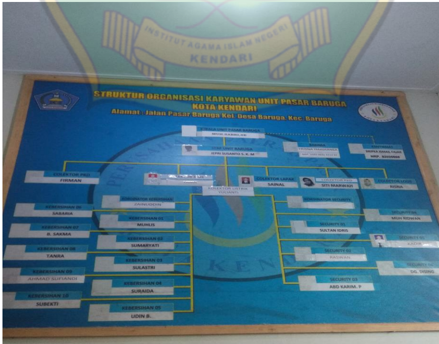
Struktur Organisasi Pasar Baruga Kota Kendari