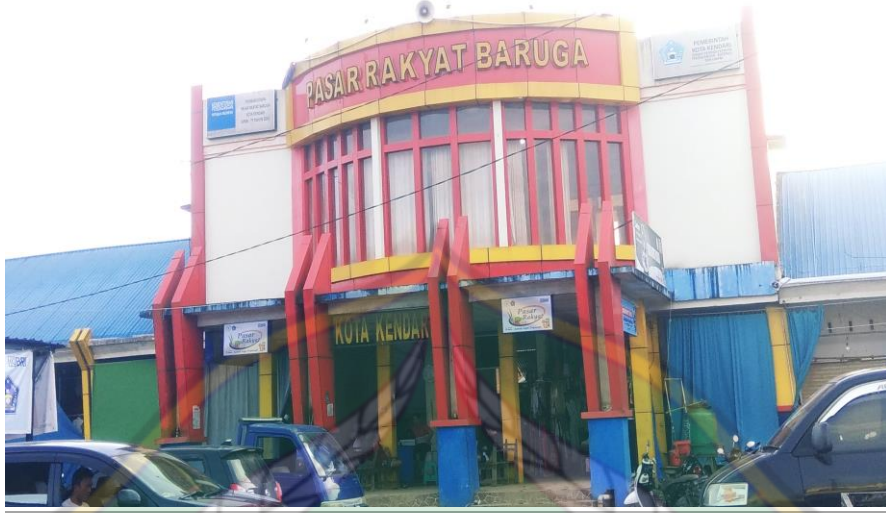
Pasar Baruga Kota Kendari