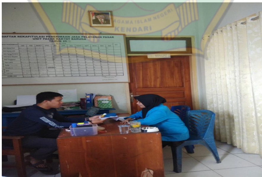
Proses wawancara pada tanggal 30 Juni 2022, bersama bapak Pengelola Pasar Baruga