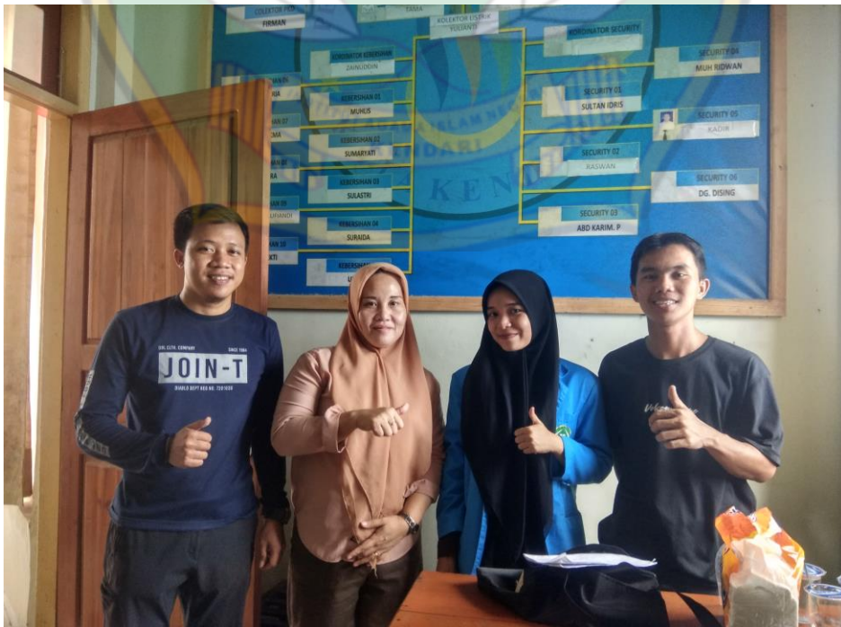
Foto Bersama Pengelola Pasar Baruga Kota Kendari