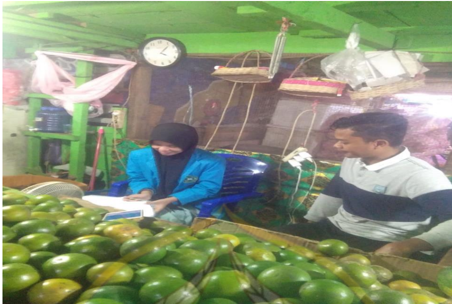
Proses wawancara pada tanggal 30 Juni 2022, bersama Pedagang Buah I di Pasar Baruga