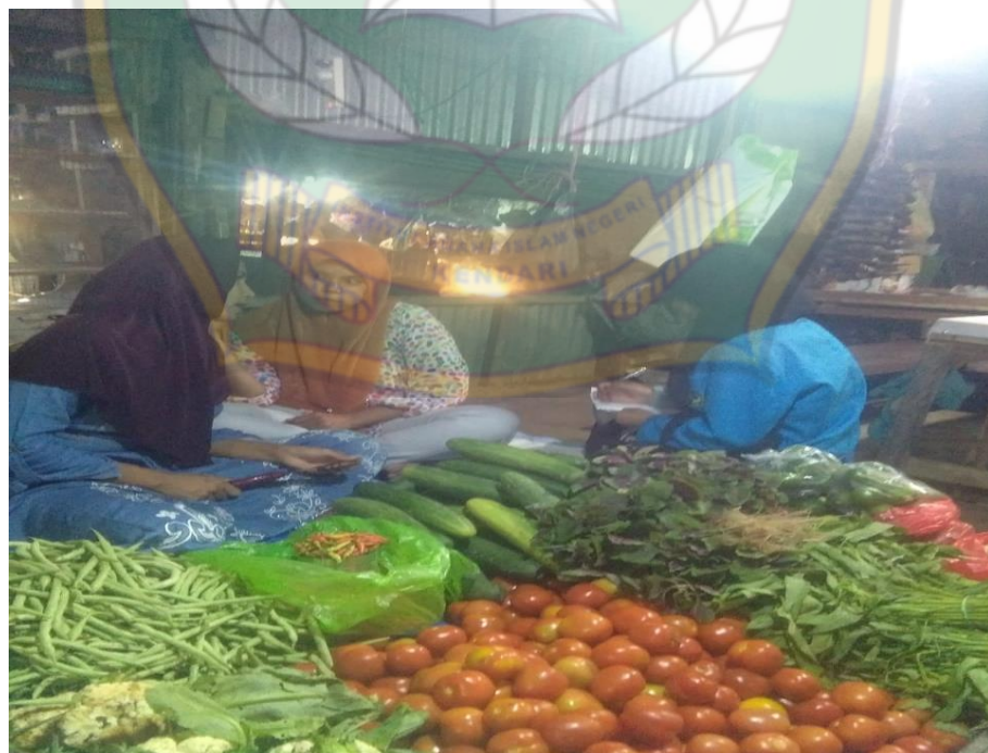
Proses wawancara pada tanggal 30 Juni 2022, bersama Pedagang Sayur I di Pasar Baruga