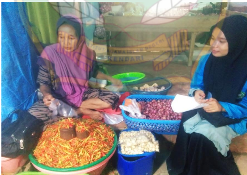
Proses wawancara pada tanggal 2 Juli 2022, bersama Pedagang Sayur XI di Pasar Baruga