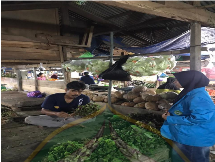
Proses wawancara pada tanggal 2 Juli 2022, bersama Pedagang Sayur VIII di Pasar Baruga