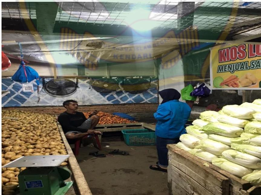
Proses wawancara pada tanggal 2 Juli 2022, bersama Pedagang Sayur VII di Pasar Baruga