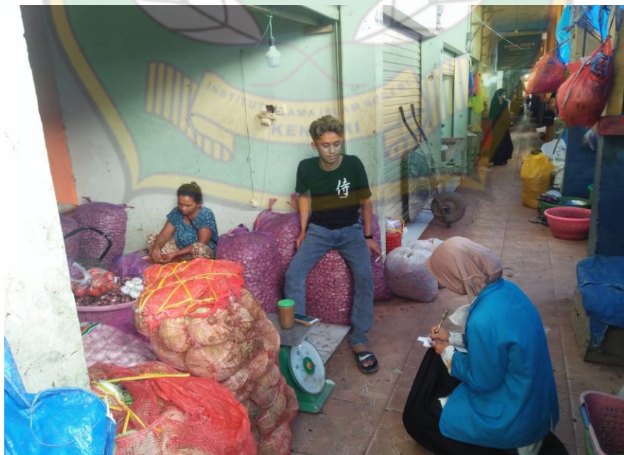
Proses wawancara pada tanggal 1 Juli 2022, bersama Pedagang Sayur V di Pasar Baruga