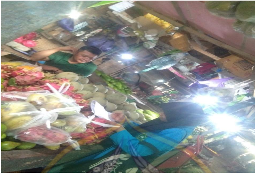
Proses wawancara pada tanggal 1 Juli 2022, bersama Pedagang Buah II di Pasar Baruga