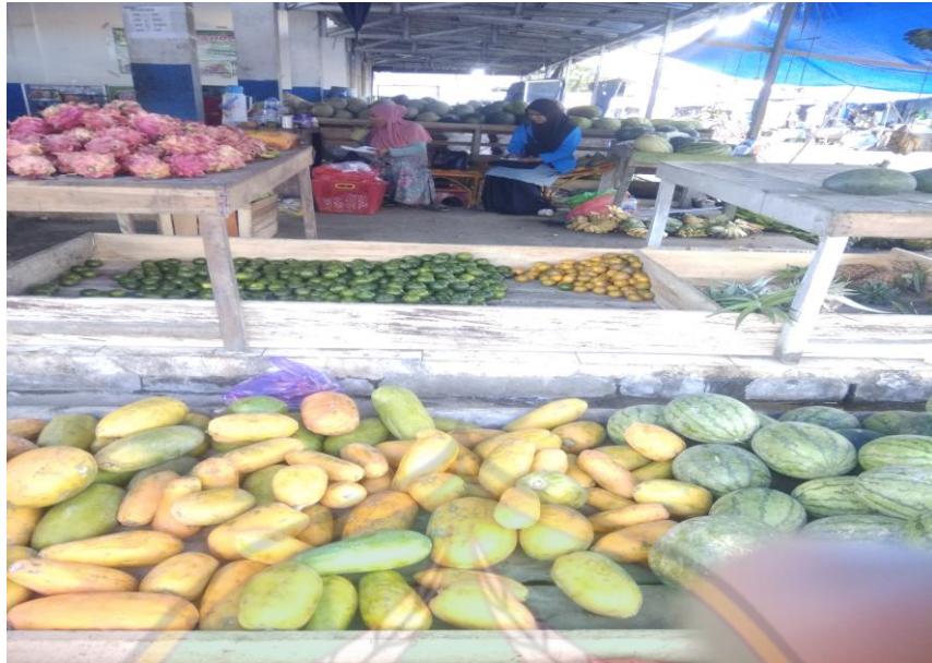
Proses wawancara pada tanggal 2 Juli 2022, bersama Pedagang Buah V di Pasar Baruga