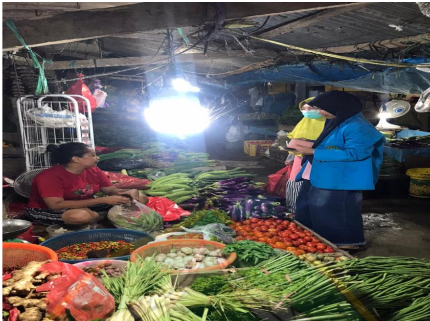
Proses wawancara pada tanggal 2 Juli 2022, bersama Pedagang Sayur X di Pasar Baruga