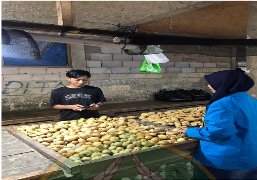
Proses wawancara pada tanggal 1 Juli 2022, bersama Pedagang Sayur VI di Pasar Baruga