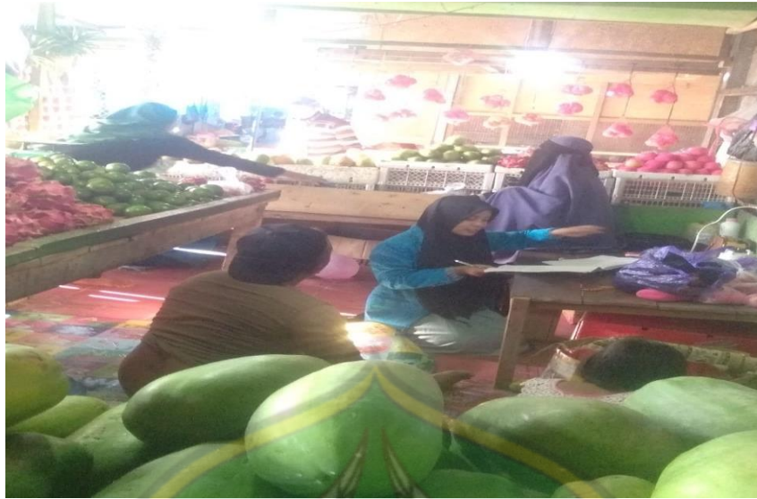
Proses wawancara pada tanggal 2 Juli 2022, bersama Pedagang Buah III di Pasar Baruga