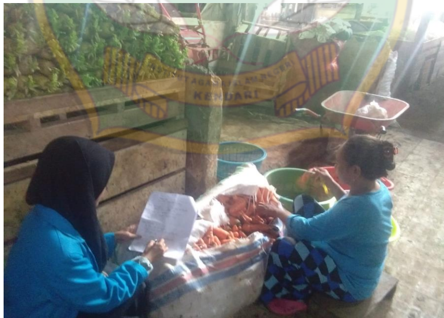
Proses wawancara pada tanggal 2 Juli 2022, bersama Pedagang Sayur IV di Pasar Baruga