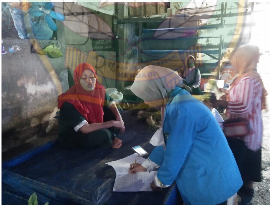
Proses wawancara pada tanggal 1 Juli 2022, bersama Pedagang Sayur II di Pasar Baruga